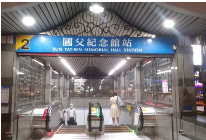
國父紀念館站2號出入口電扶梯啟用