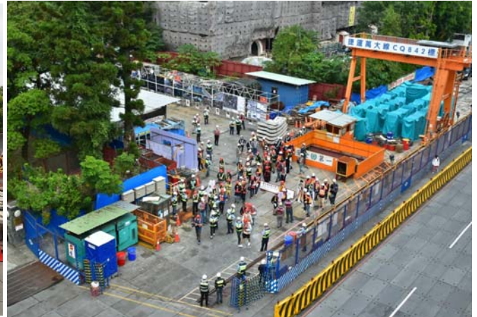
民眾參與OPEN HOUSE TAIPEI活動