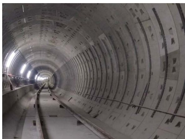
圖3 中和站至連城錦和站間隧道完成現況