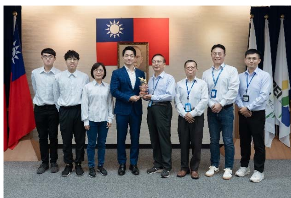
圖2 臺北市政府創意提案競賽精進獎得獎合影