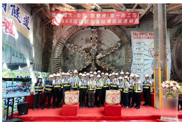
圖1 潛盾隧道全段貫通典禮

本區段標採用潛盾機頂升滑移通過中和高中站的工法，榮獲112年度臺北市政府創意提案競賽精進獎特優。更從行政院公共工程委員會傳來捷報，CQ860區段標榮獲「第23屆公共工程金質獎」公共工程品質優良獎特優的殊榮，讓施工團隊的努力備受肯定。