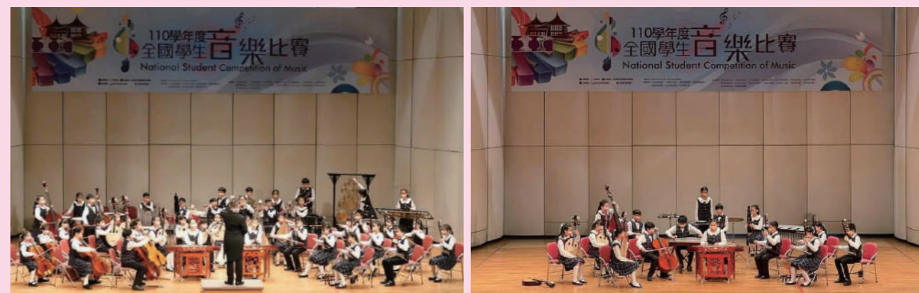
左：臺中市中區光復國民小學音樂班國樂組參與 110 學年度全國學生音樂比賽 — 合奏比賽 / 右：絲竹比賽。

「全國學生音樂比賽」的宗旨在「培養學生音樂興趣，提昇音樂素養」、「加強各級學校音樂教育」。以「萌芽時期」算起迄今，國樂在臺灣的發展已逾 60 年。最初音樂班依據《特殊教育法》設立，為符合藝術才能資賦優異條件，學生入學時加考智力測驗、性向測驗。這型態的音樂班，國小三年級開始招收，每班 30 人。當時一縣市僅 1 所國小、國中設立音樂班，西樂器主修，僅有少數音樂班有國樂器主修，人數不多，無法國樂合奏。高雄市前金國小民國 78 年設立音樂班，是第一所全以國樂器主修的音樂班。非音樂班學校成立國樂團，多以普通班學生為主要成員，由該校專任教師負責組訓，有些學校學生分散在各班，有些學校把學生集中成 1 班以利組訓，視各校環境、文化與條件，挹注各項軟、硬體不同資源：人力資源、物力資源、地方資源等，多利用課後方式進行練習，不佔正式課程節數。在尚未實施週休二日之前，星期六常是社團活動最好的時間，學校專任教師常把國樂團當校隊義務指導，不足之處，才請外聘教師協助。