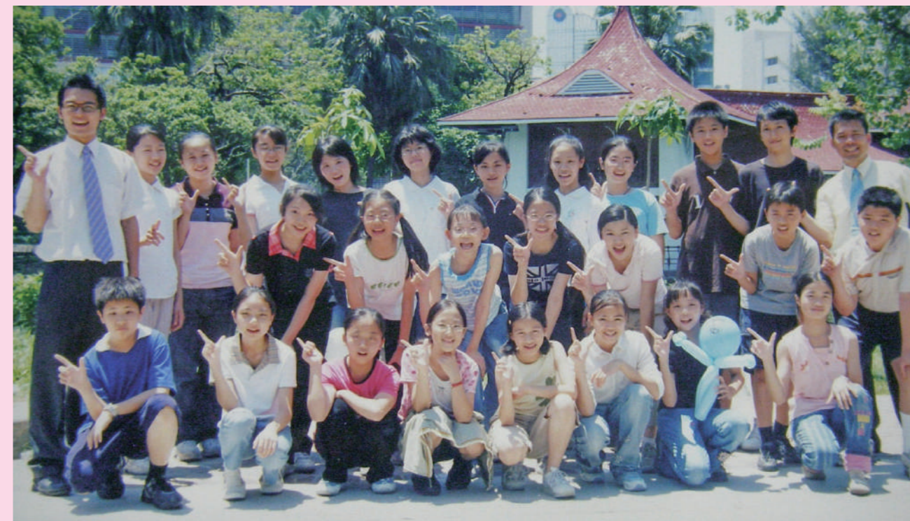
2005 年臺中市區光復國民小學最後 1 屆非音樂班的國樂班畢業。

國樂合奏之所以悅耳動聽、之所以成功，就是因為教師懂得每一位團員的特性，懂得傾聽與調整。而做這件事需要技術、更是藝術，對推廣國樂而言，才算加分。