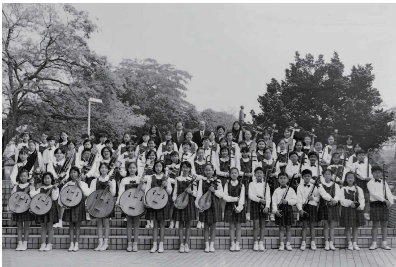
臺中市中區光復國民小學第 1、2 屆非音樂班的國樂班。

國樂師資除「專業教育時期」科班養成之外，師範體系培育的國中、小教師，也是推廣國樂發展的一大助力，尤其當時的師範專科學校。每校約有十分之一的人曾經參加過國樂社，加上各項教育專業科目、教材教法、課程設計等訓練，畢業後從事國樂團組訓，能針對國小學生設計符合其身心發展的教學方式，貼近學童需求，靈活運用班級經營與學童個別差異雙管齊下，打穩初學基礎，這對國小階段的學生影響深遠，目前臺灣國樂界有許多優秀的演奏家，就是由國小教師啟蒙。