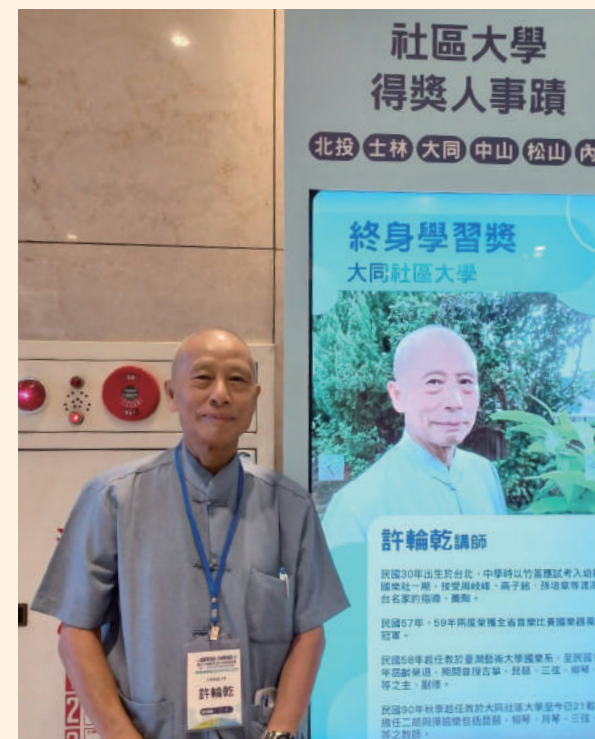
代表大同社區大學獲頒「終身學習獎」。

如果以 15 年算一個世代，國樂在臺灣已有五代，是發展成熟的終身學習教育。無論你的年紀、身份、居住在都市或鄉間，只要有心想學，都能找到適合的環境、場域學習。無論是在學生、出社會工作者或是退休人士，一定有適合的國樂班級可以加入。過去諸多研究指向：現代國樂的起點為 1948 年中央廣播電臺音樂組來臺演出，待 1949 年國民政府遷臺後，7 位團員來臺組成中廣國樂團，對現代國樂產生了影響。即便如此，筆者仍以為，當種子遇到適當的陽光、空氣、水、土壤，就會自然的生長是相同的道理。國樂能在臺灣這塊土壤蘊育茁壯，「人心之所向」才是國樂持續發展的關鍵。由於國樂有與時俱進的特點，它蛻變更新的速度非常的快，一般人學習它，不會覺得它遙不可及，卻又一直有新的材料可學習，無論是超越自我或是忘我的高峰體驗，音樂相較於其他藝術，是快速體驗之捷徑，這也是國樂一直深受歡迎的原因之一吧！