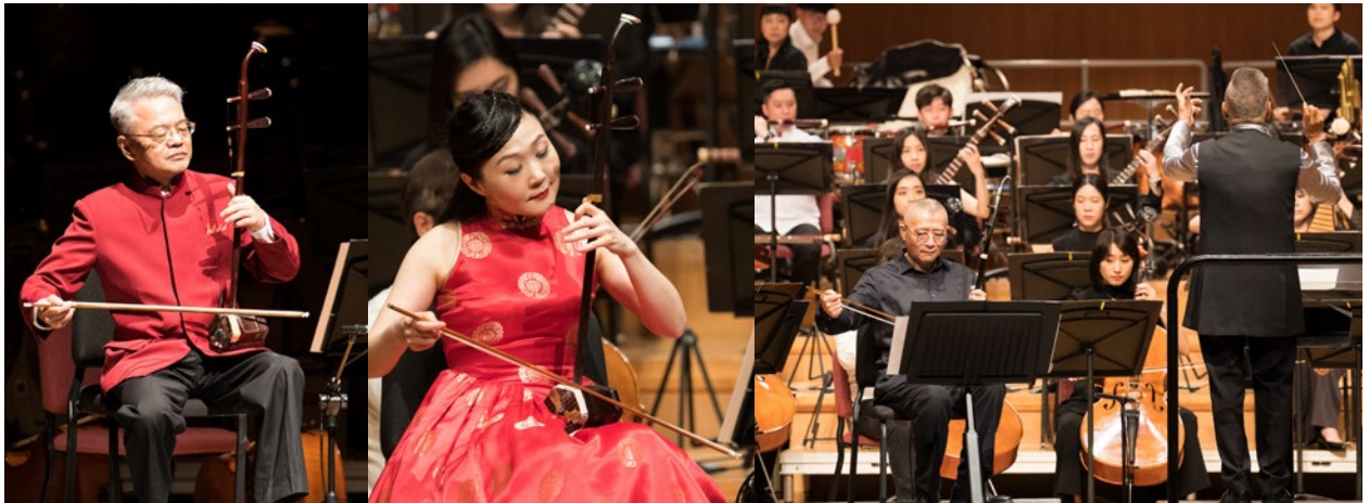
2023 臺北市民族器樂大賽評審團於「弦悅」音樂會的精湛演出