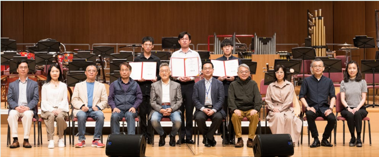
2023 臺北市民族器樂大賽頒獎合照

其實在上一次的二胡大賽（2019）中，當時的評審朱昌耀就曾表示，在快速技巧方面，臺灣與大陸幾乎已沒有差距，因此在比傳統樂曲時，通常就已決定了結果。幾年下來，當臺灣組選手在傳統曲目仍然表現出了明顯的不足，不由得令人反思，在追求快速技巧精進的同時，是否不經意地遺忘，只有汲取傳統樂曲所帶來的養分，才能在演奏層面結出更飽滿的果實？