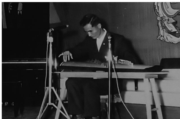
慶祝總統華誕暨救國團 18 週年團慶音樂會，於臺東介壽堂古箏表演