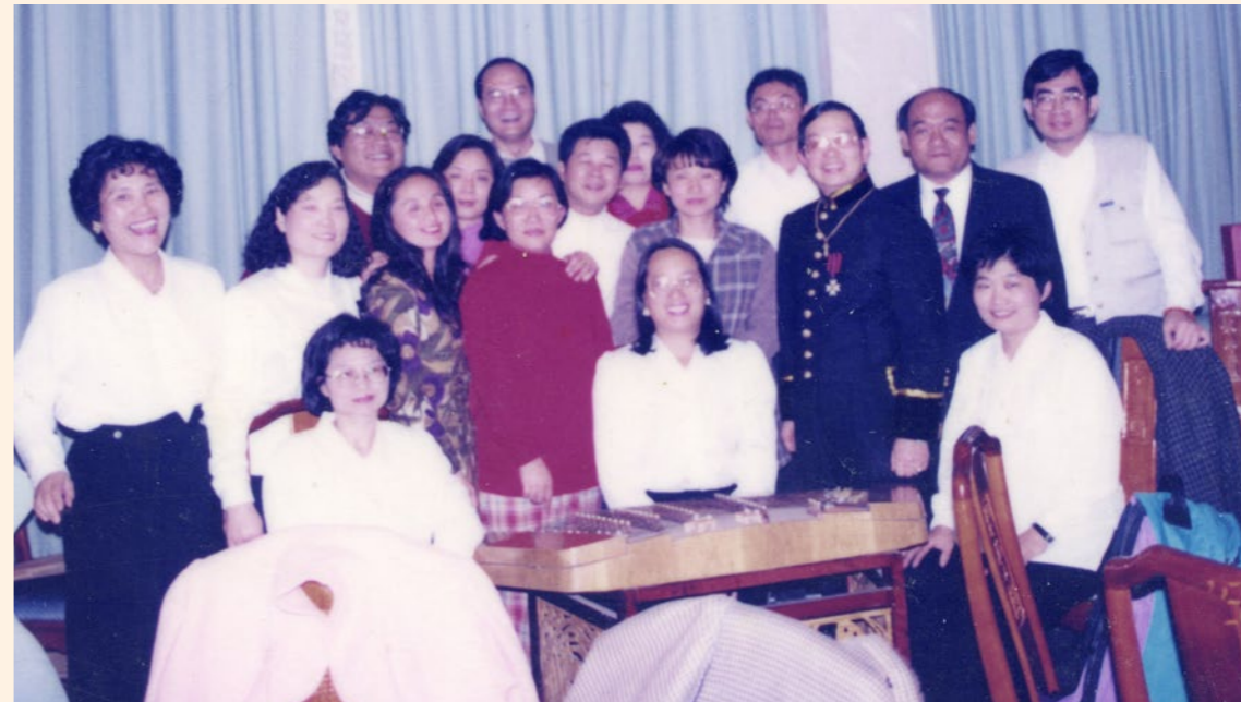
郵光國樂團部分團員之合影