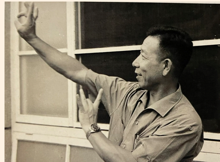
李天民示範蘭花指（1954年）