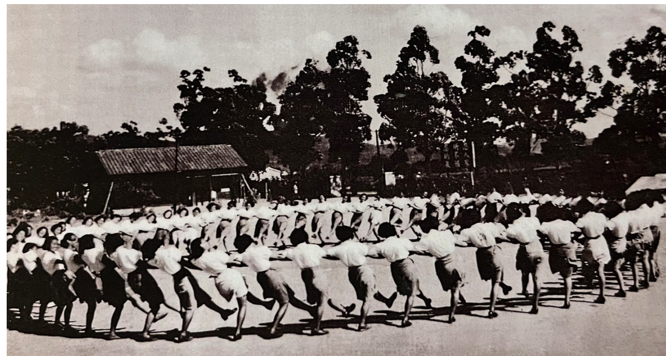
1950年，國防部女青年工作大隊在復興崗唱跳李天民教授之《高山青》聯歡舞

李天民（1925-2007）出生於遼寧省錦縣，自小習舞，畢業於滿州映畫學院，20歲即擔任歌舞團團長，21歲任國軍政工隊隊長，不僅善舞亦擅音律。李天民23歲來臺（1948年11月11日），初到臺灣落腳於屏東，由於亟需一份穩定的工作，所以先在高雄西子灣進修國民學校擔任老師，不久見報紙刊登屏東師範學校徵求舞蹈老師，李天民前去應徵，同時在兩校任教了三個學期。由於屏東師範學校的習舞者，都是即將進入小學任教之教師，李天民系統化的舞蹈教學，為南臺灣舞蹈教育播撒下種苗。