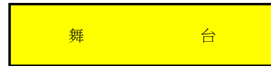
一樓前九排座位為交錯排列(避免前排擋視線)