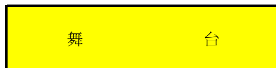
一樓前九排座位為交错排列(避免前排擋視線)