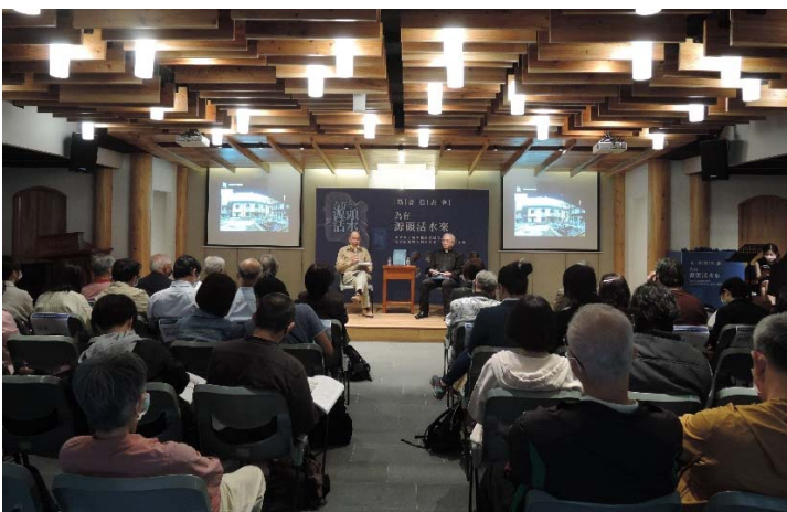
新書發表會座談一景