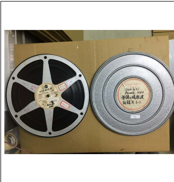
華視新聞與資料膠卷