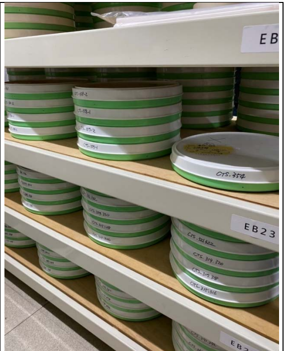
整飭完成的膠卷保存於專用收納盒中