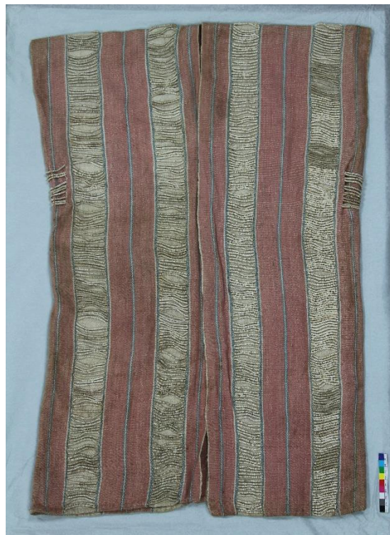
泰雅族貝珠衣(臺北市立文獻館)