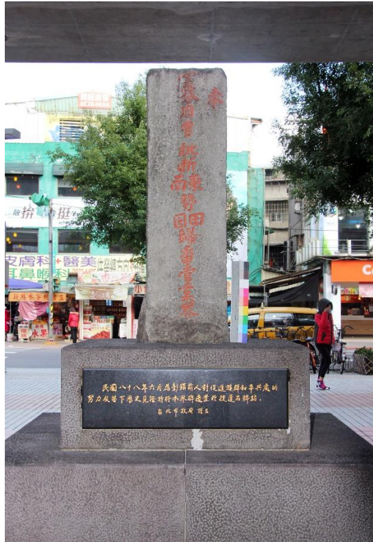
石牌漢番界碑(臺北大眾捷運股份有限公司)