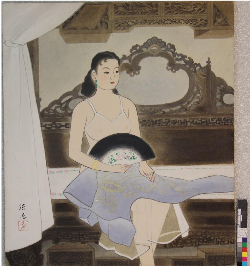
陳進 洞房(順益台灣原住民博物館)