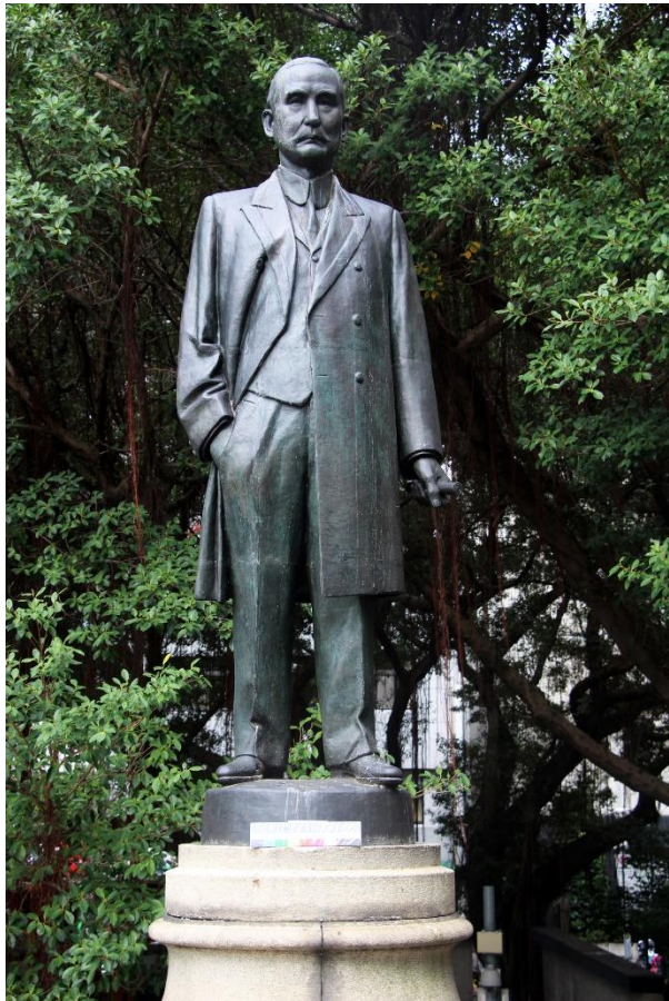
蒲添生-孫中山銅像(臺北市中山堂管理所)