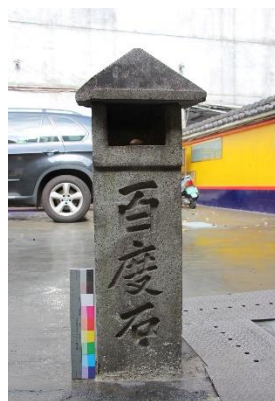
「南無妙法蓮華經」及「百度石」(財團法人臺北法華寺)