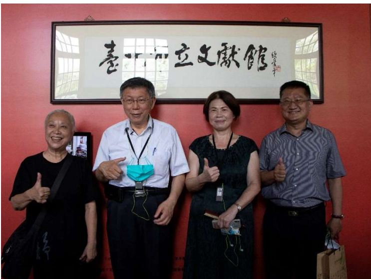
柯文哲市長與來賓參觀「第70話—臺北市立文獻館典藏特展」，左起：霞海城隍廟陳文文女士、柯文哲市長、文獻館詹素貞館長、萬華區詹天保區長