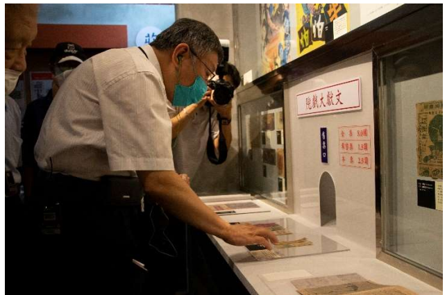
柯文哲市長參觀「第70話—臺北市立文獻館典藏特展」