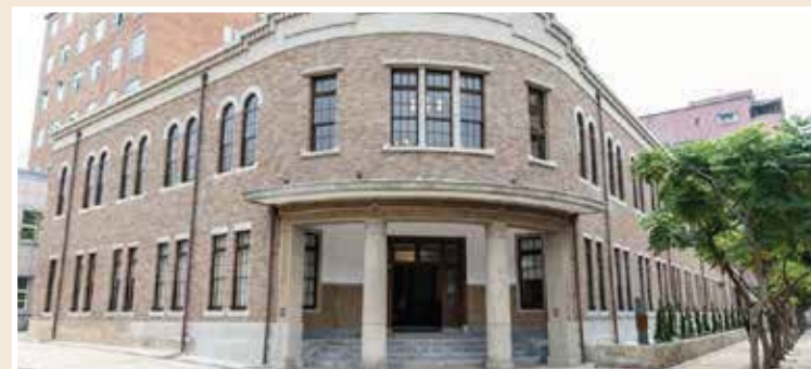
臺灣新文化運動紀念館

捷運大橋頭站→永樂國小→仁安醫院→慈聖宮→大稻埕教會→李春生宅→臺灣新文化運動紀念館（臺北北警察署即舊大同分局）→蔣渭水紀念公園→靜修女中→新芳春茶行→義美食品門市（大安醫院舊址）→二二八事件引爆地紀念碑。