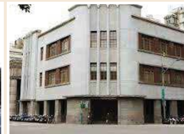
三井物產株式會社舊廈