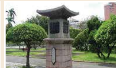
臺灣廣播電台放送亭