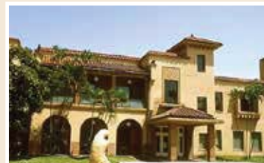
台北二二八紀念館