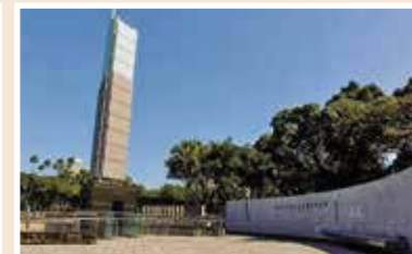
白色恐怖政治受難者紀念碑