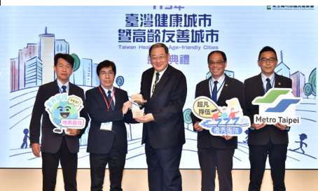
榮獲高齡友善城市獎

以「傳遞愛與關懷」為主軸，自創IP角色捷米(JAMIE)，攜手親子友善大使麻吉貓，透過動畫短片與插畫圖文等多元形式，加強宣導「輕聲細語」、「後背包改為手提或前揹」等乘車禮儀，同時於車站設置「扶梯兩側皆可站立」等安全告示，形塑安全有禮的捷運文化。