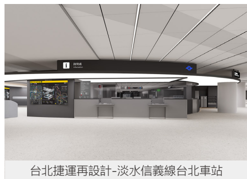
台北捷運再設計-淡水信義線台北車站

秉持以人為本的設計理念，延續中山站改造經驗，展開淡水信義線台北車站改造計畫，優化導引標示、整合通行動線與商業設施，並導入智慧化管理系統，提高旅客便利性與服務效能。