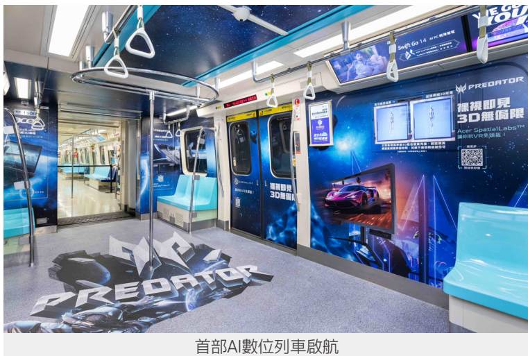
首部AI數位列車啟航

響應全球淨零碳排趨勢，以「捷淨生活 美好展開」為永續願景，帶動節能減碳與綠能應用。透過智慧營運、汰換高耗能設備、建置太陽光電與電動公車充電站等措施，強化低碳運輸網絡，落實環境永續的承諾。