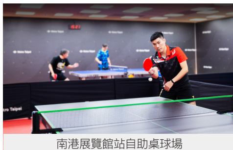
南港展覽館站自助桌球場