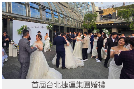
首屆台北捷運集團婚禮