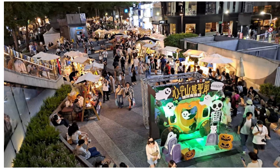
心中山萬聖節 哈囉鬼派對！