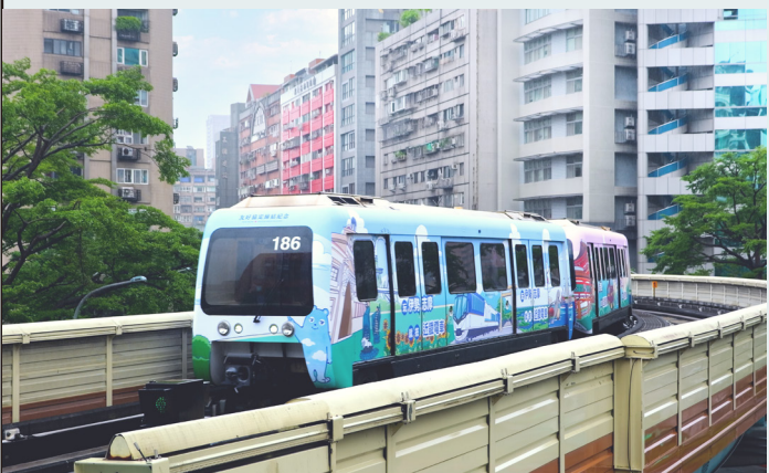
台北捷運 × 近鐵集團彩繪列車

觀光推廣方面，與多家鐵道同業建立友好關係，透過宣傳資源互惠合作，展現友好情誼，提升國際旅客對台北捷運的認同，進而帶動雙方觀光旅遊業務之發展。