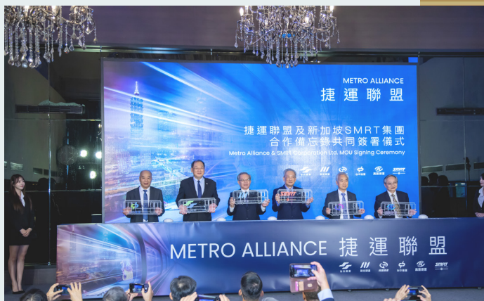
捷運聯盟與新加坡SMRT集團共同簽署合作備忘錄