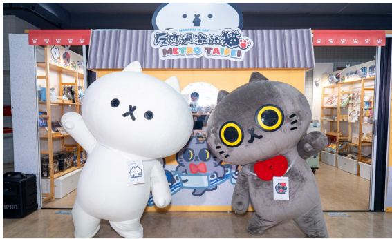
反應過激的貓商品館

結合捷運場域與周邊生活機能，於重要車站廣場及心中山線形公園辦理各式主題市集活動，活絡城市公共空間，更與路易莎合作開設聯名咖啡廳，讓捷運成為貼近民眾日常的城市風景。