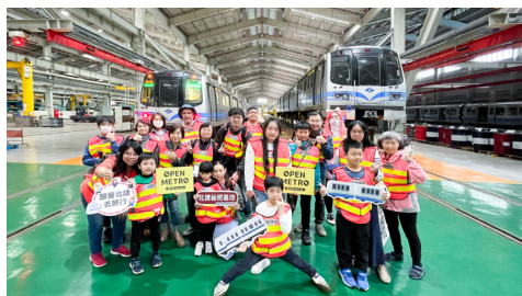
捷運小小職人體驗營