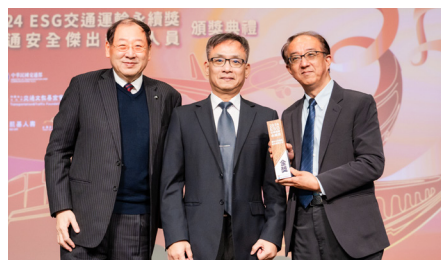
榮獲第一屆ESG交通運輸永續獎金獎

旅客亦可經由「台北捷運Go」App查詢列車即時動態與車廂擁擠度，享受個人化行前規劃、會員專屬優惠與生活事業服務，串聯為一站式智慧生活平台。