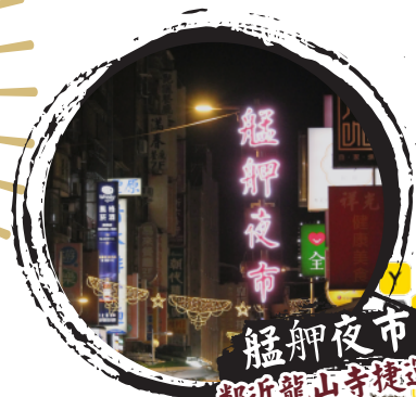
艋舺夜市 鄰近龍山寺捷運站