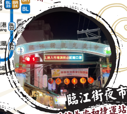
臨江街夜市 鄰近信義安和捷運站