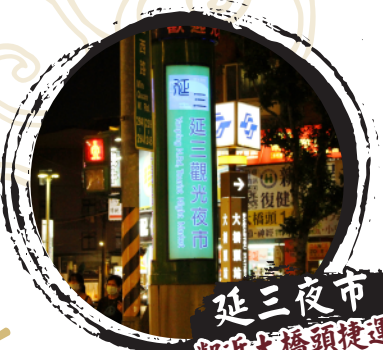
延三夜市 鄰近大橋頭捷運站