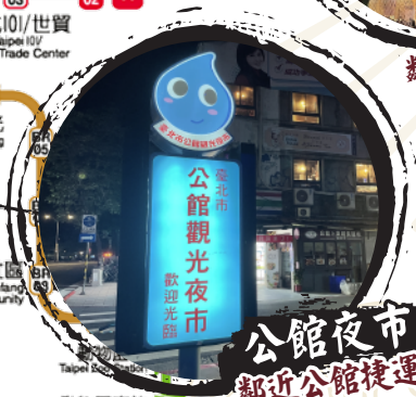
公館夜市 鄰近公館捷運站