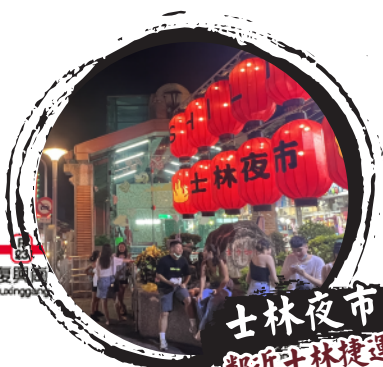
士林夜市 鄰近士林捷運站