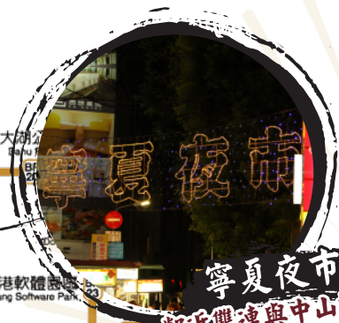
寧夏夜市 鄰近雙連與中山捷運站