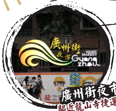
廣州街夜市 鄰近龍山寺捷運站