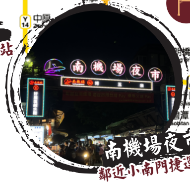
南機場夜市 鄰近小南門捷運站