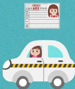
持學習駕駛證 在駕訓場外駕車， 且無有駕照者在旁指導