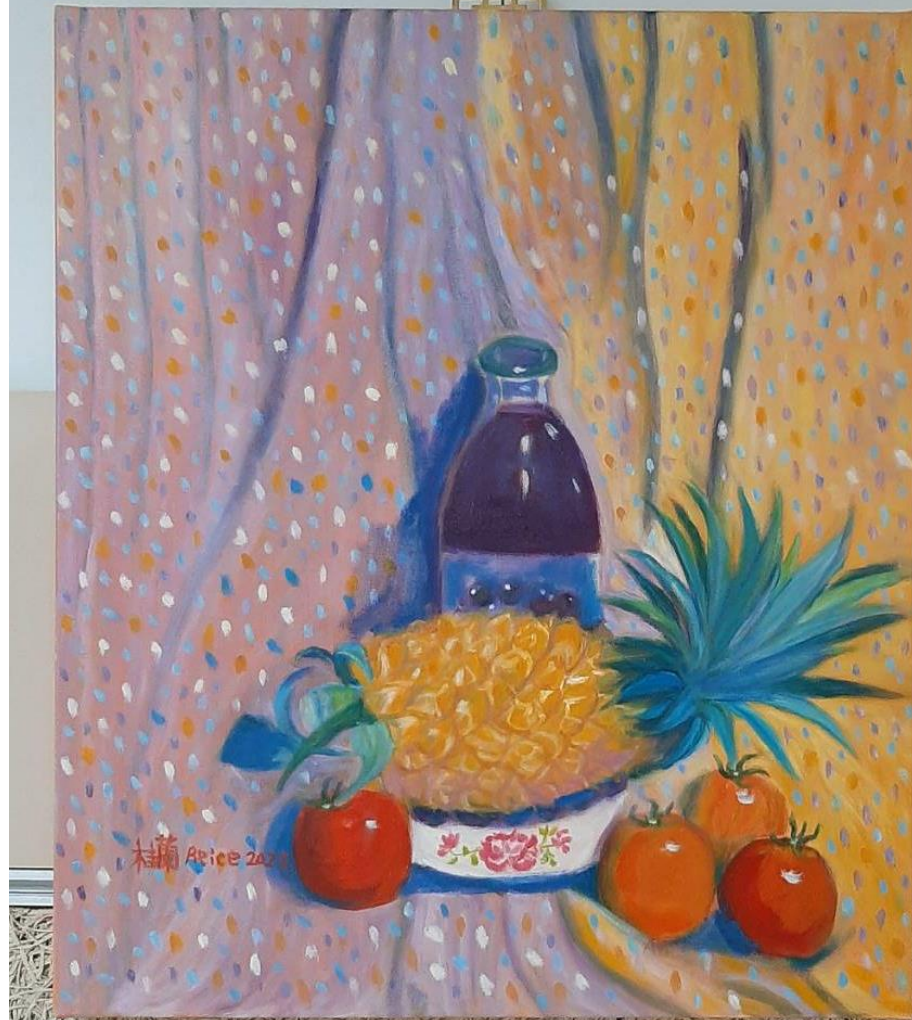
恩典夠用的祿 題目 豐收 歡樂 尺寸 10F 材質 油畫 說明