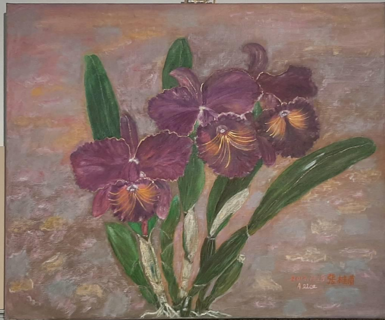
喜慶的節 2014 張桂茵 Alice 油畫