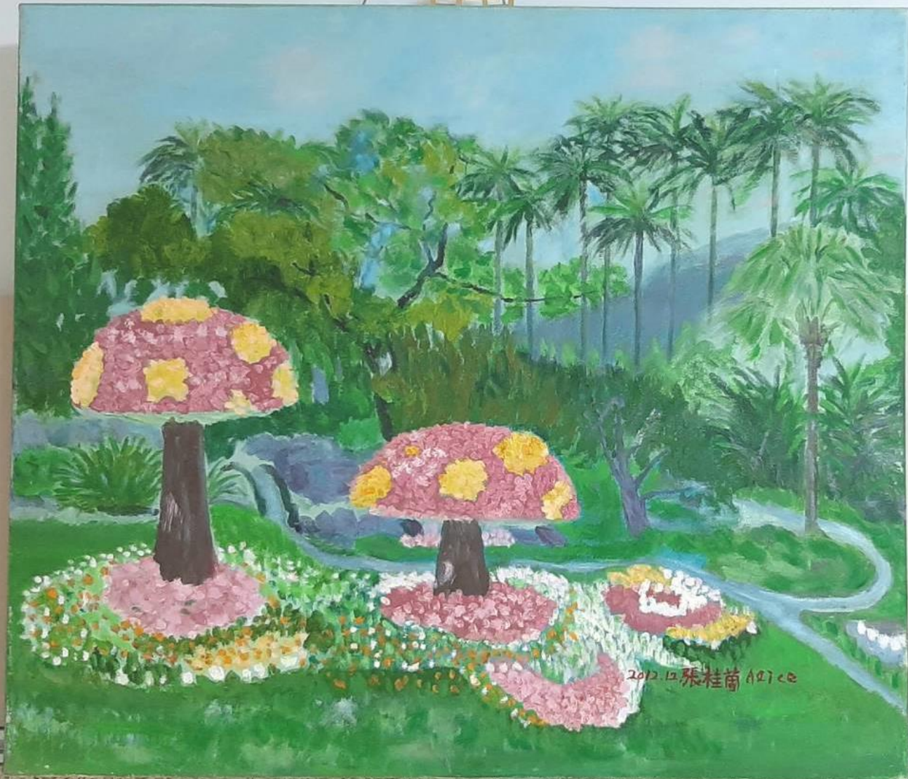
恩典夠用的祿 張桂蘭 畫 題材 自然風景 尺寸 10F 材料 油畫 年份