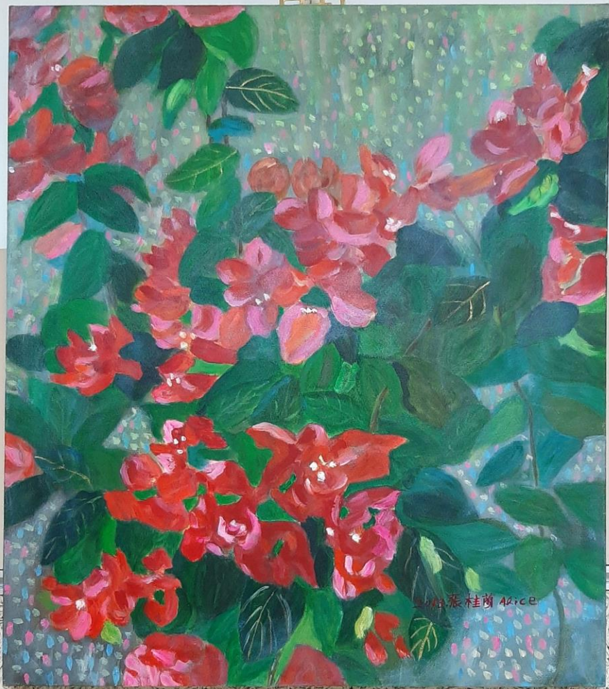
恩典夠用的祿 題目 團結力量大 尺寸 10F 材質 壓克力 說明