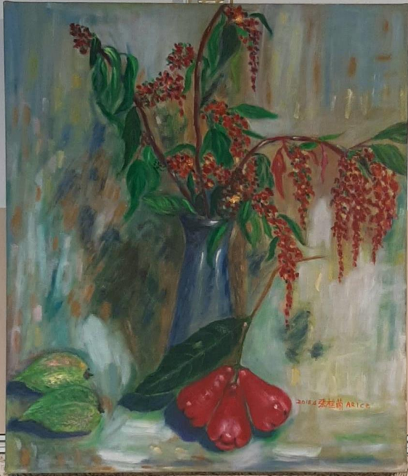
喜慶的節 2014 張桂茵 Alice 油畫