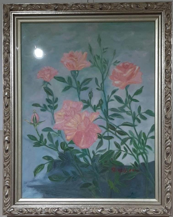
經典胸前的你 畫名 鑽葉 尺寸 20x20 材質 油畫 類別 玫瑰花