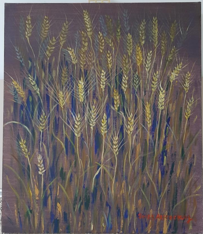
恩賜的野 莊家 10号 張麗芳 麥子