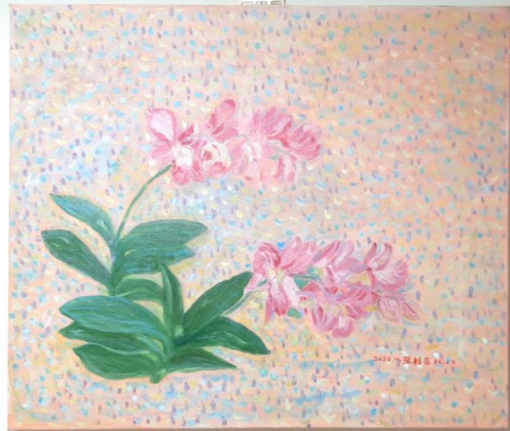
经典构图欣赏 · 逆光布上 · 10号 · 聚宝力 · 吴树雷画