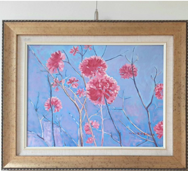
經典與用的款 畫名 櫻花 尺寸 110x110 材料 油畫 時間 2022年