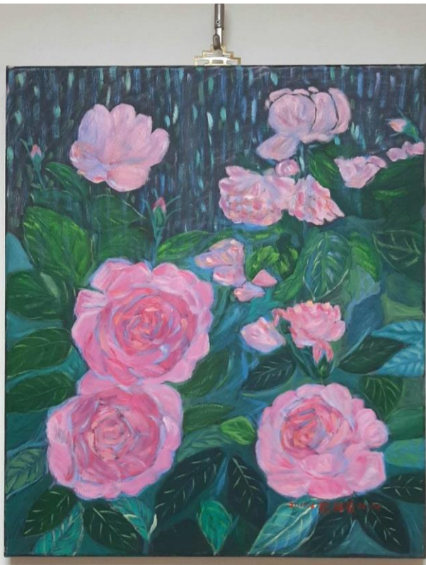
經典與用的款 畫名 玫瑰 尺寸 110x110 材料 油畫 時間 2022年