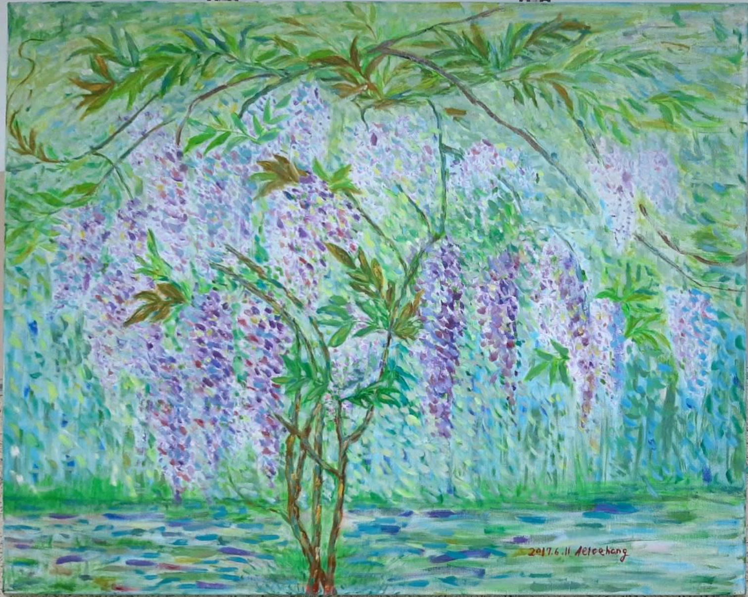
原典物用の池 2017.6.11 2017.6.11 2017.6.11