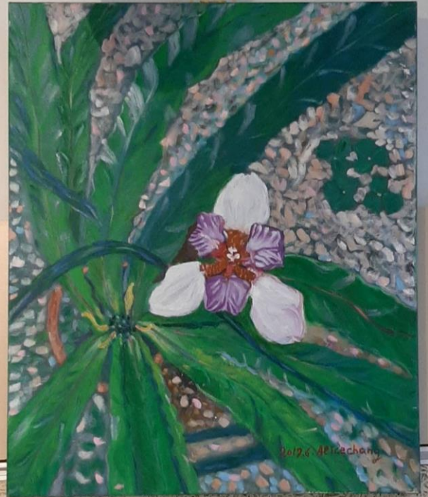
喜慶的節 2014 張桂茵 Alice 油畫