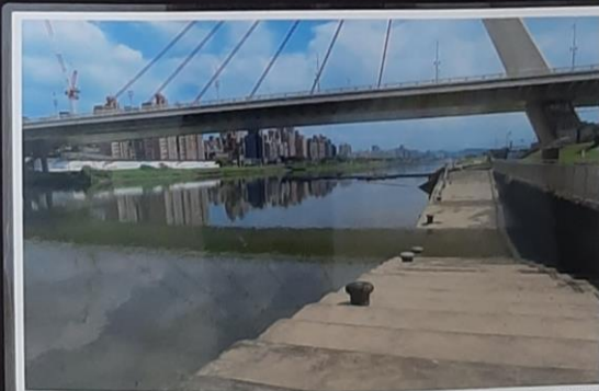
大直橋下斜坡道~救生碼頭