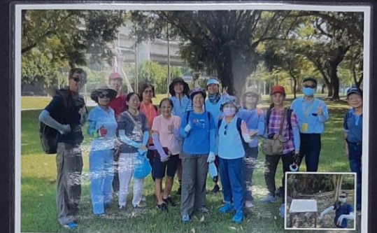
國定圓山考古遺址