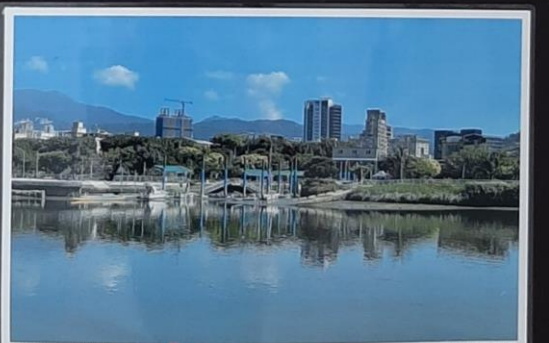
遠眺三腳渡碼頭5 戶外無圍牆博物館，也是基隆河最完整的設有水文化及休閒設施，(包含大直橋下、巨鯨碼頭碼頭、雙溪洲及臨河碼頭等處)