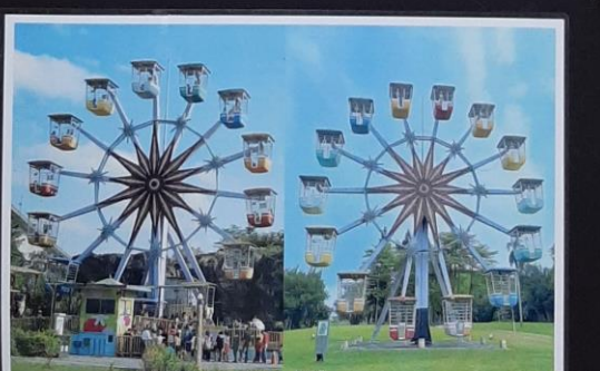
舊圓山兒童樂園的昔與今 2014 vs 2022