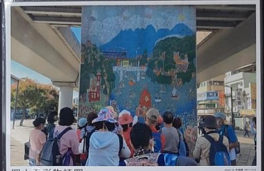
圓山五彩物語圖 - 簡介圓山最有特色的建築公共藝術