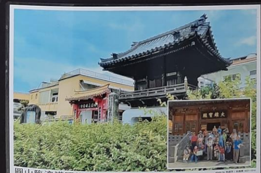
圓山臨濟護國禪寺 於1912年創設，是至今仍在時期保留最大木構造佛寺。1988年核定當中的大雄寶殿及鐘樓門為直轄市市定古蹟