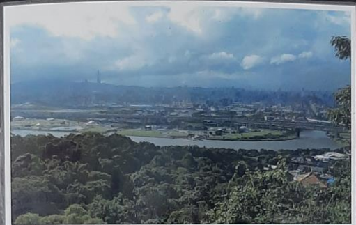
遠眺四獸山南港山稜線與台北盆地。近看基隆河大佳河濱公園松山機場。