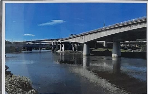
中山區基隆河左岸遠眺中山橋