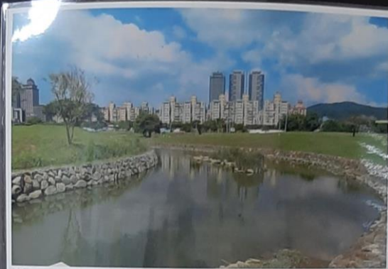
美堤公園自然親水灣