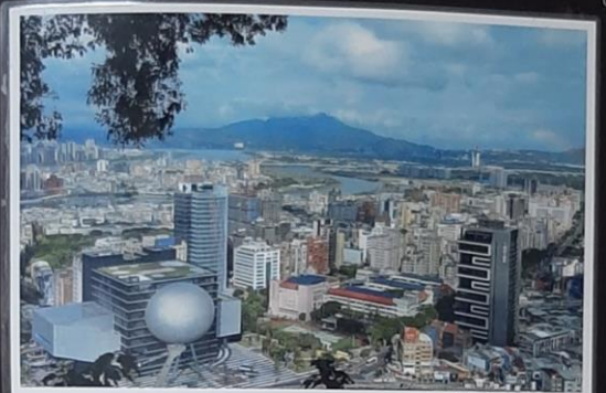
遠眺林口台地社子島，近看士林表演藝術中心