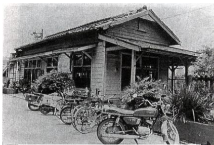
日據時代南港火車