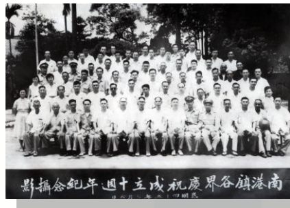
民國 45 年南港成立 10 週年 (南港回顧)