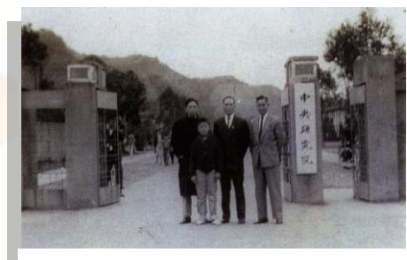
中央研究院舊大門