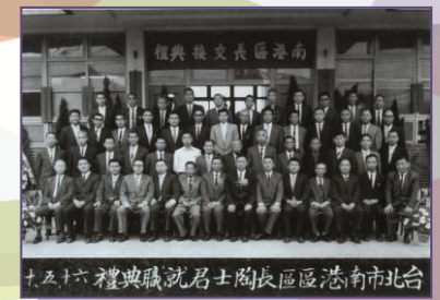
民國 57 年南港改制為區 (南港回顧)