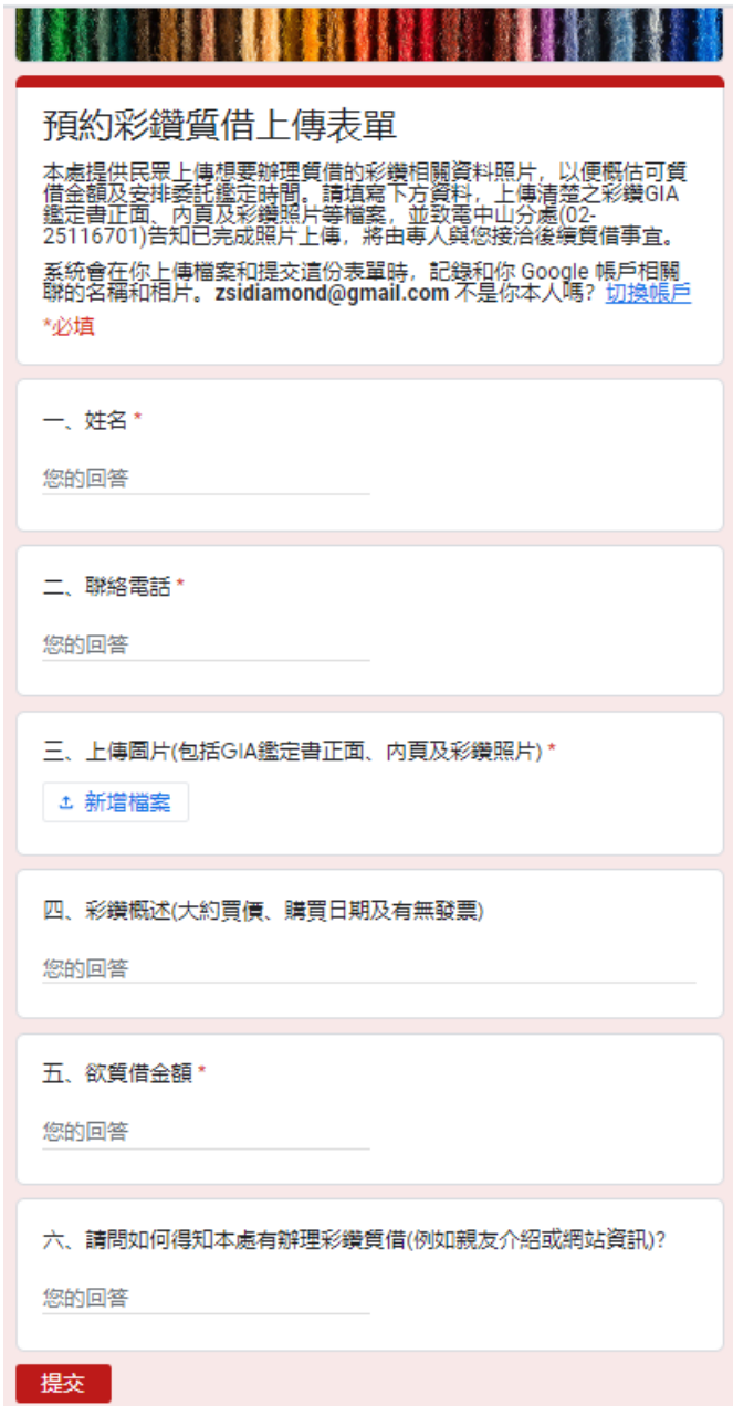
圖 5：預約彩鑽質借上傳表單