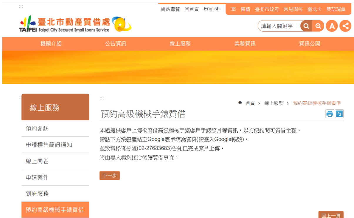
圖 2：本處官方 line@/輸入”手錶”2字/提供 google 表單連結