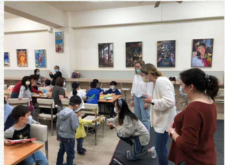
Topic : Where the Wild Things Age