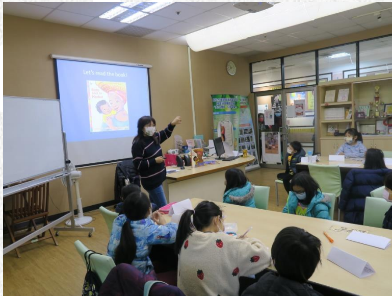
Topic : Baby Goes to Market

English story telling as a long term program let children enjoy learning English and American culture at the same time!