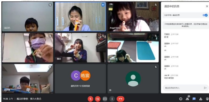
Topic : Science Club

We have many different topics of culture lectures, include movies, music, travelling, sciences. When people attend these lectures, they learn deeply about American culture and history.