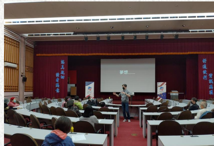
Topic : American Highway