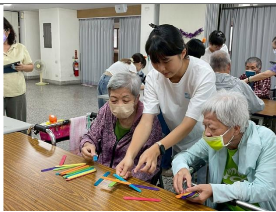
在老吾老養護中心與高齡長者互動同樂-2

截至 113 學年第 1 學期，我們的足跡遍及臺南、嘉義、高雄、屏東，累計有來自不同學院老師與館員 70 人次參與、服務過 56 個單位（學校）、修課學生達 438 人，接受服