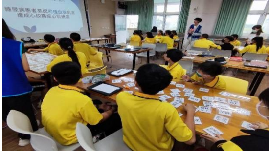
圖 12 活動當天上課與遊戲互動