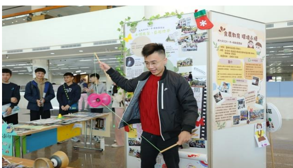
圖 1 「移動圖書館」課程反思與回饋成果展-1