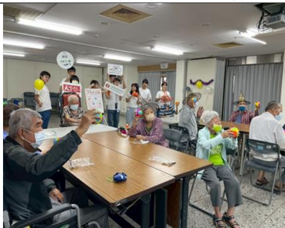
圖 6 前往臺南市立圖書館挑選適用圖書-1