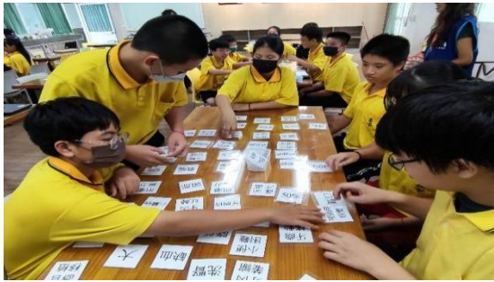
圖 11 活動當天上課與遊戲互動