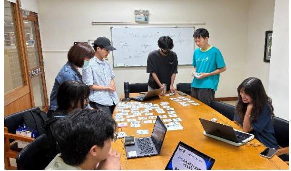
圖 10 活動前討論與演練-2