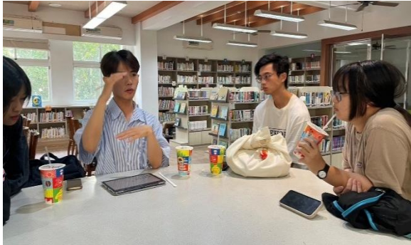
圖 9 活動前討論與演練-1