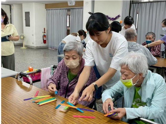
前往臺南市立圖書館挑選適用圖書-3