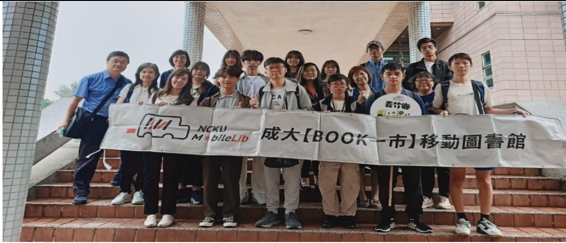
「多喝水－健康腎力」全體服務團隊合照留影