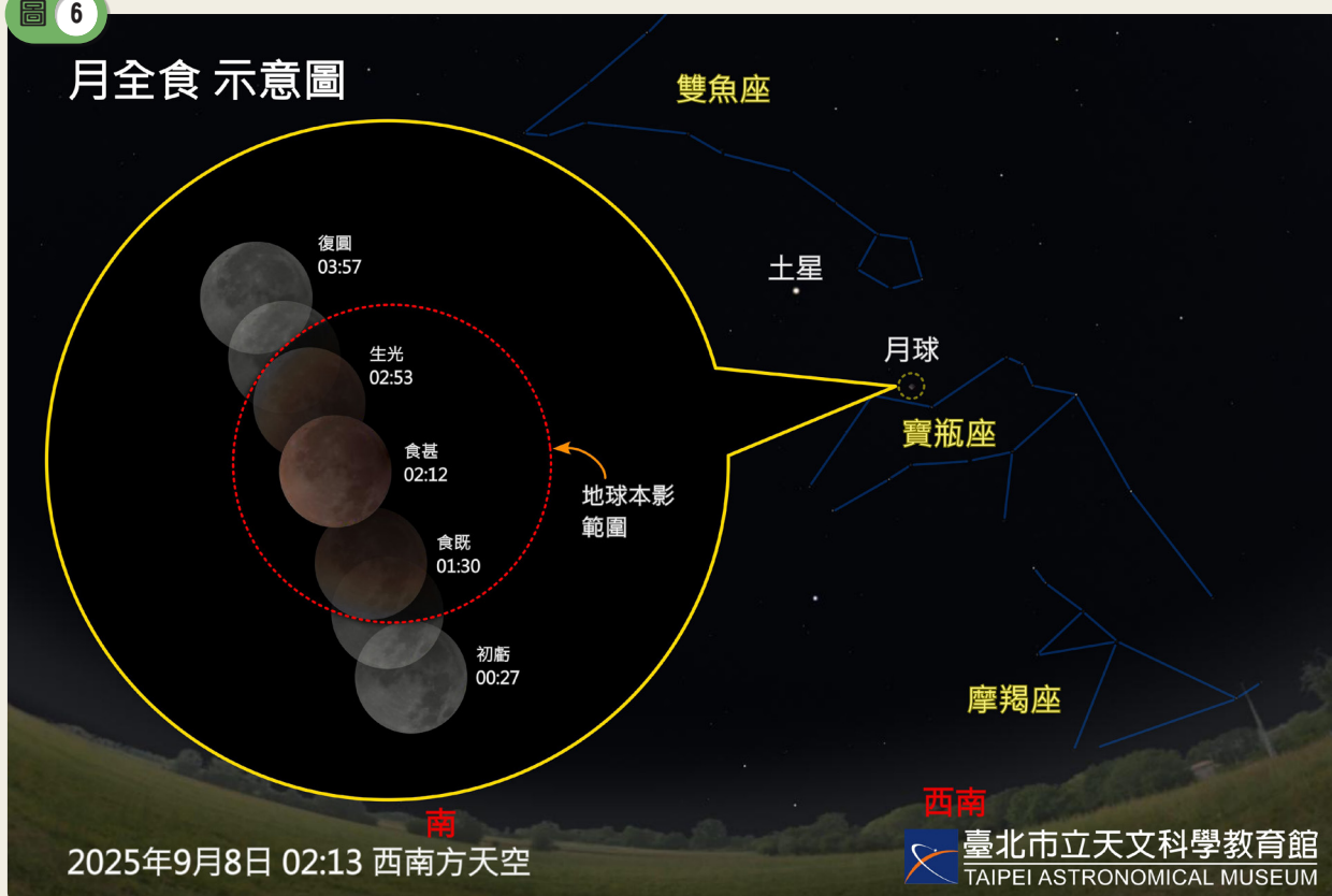
今年9月8日月全食發生時的模擬示意圖。