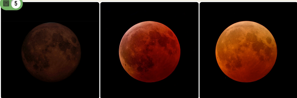
在大氣環境條件與仰角不同的情況下，月全食時的月面所呈現顏色和明暗程度會有明顯變化。