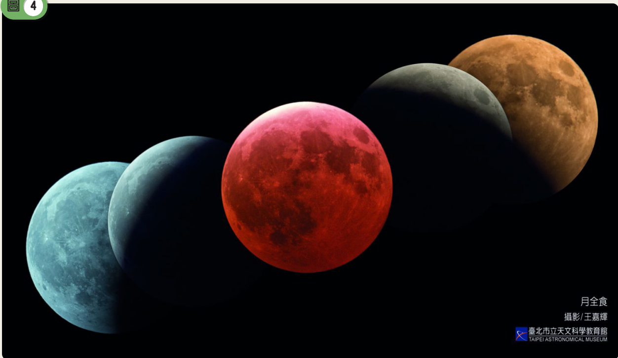
2018年1月31日拍攝的月全食影像，可見月球進出地球本影時的顏色與明暗變化，以及地球本影的範圍。