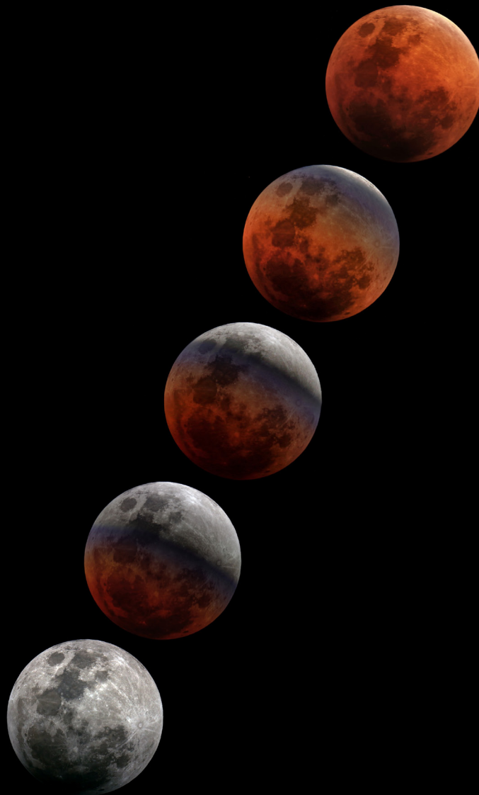
月食過程間隔攝影

上次臺灣可見完整過程的月全食，發生於7年前的2018年1月31日。