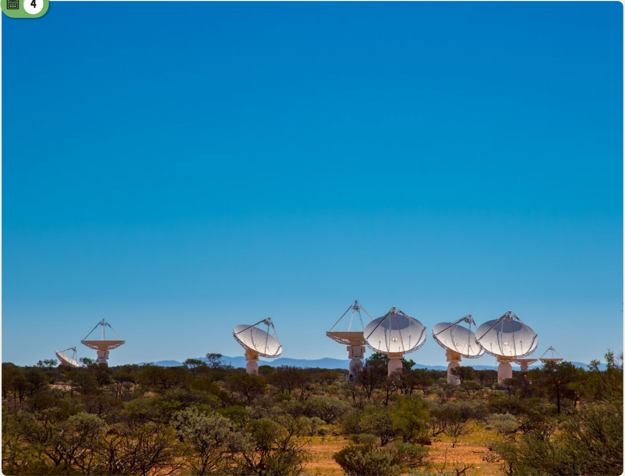
另外，位於澳洲的ASKAP亦是重要的無線電望遠鏡陣列之一。