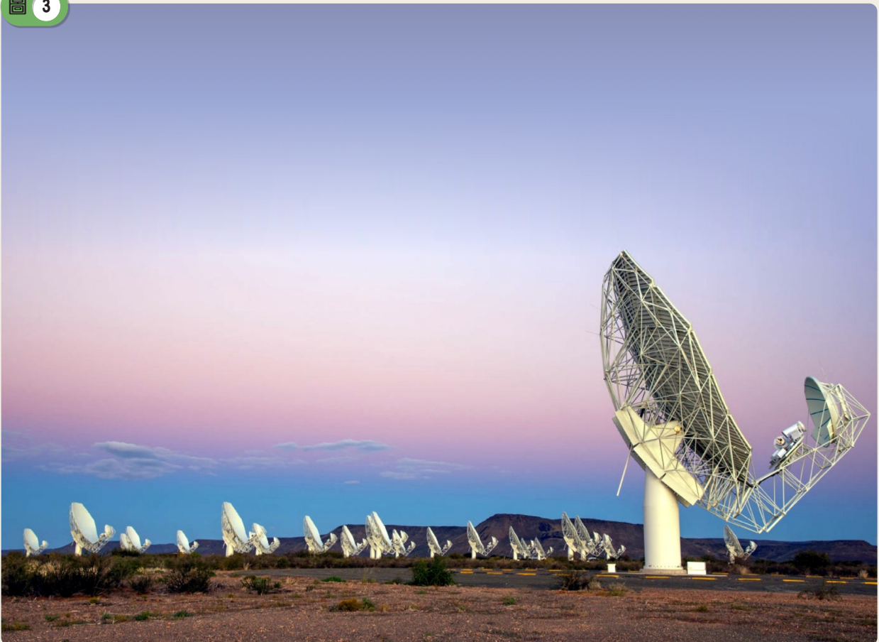
除了內文提到的SMA、ALMA與VLA之外，位於南非的MeerKAT也是當代重要的無線電望遠鏡陣列之一。