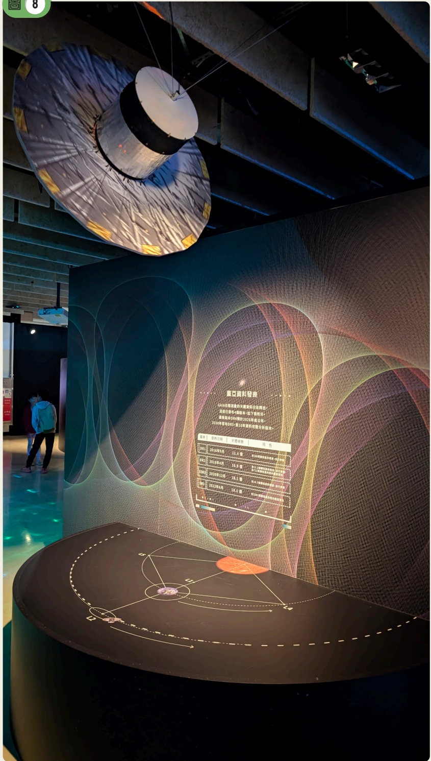
蓋婭太空望遠鏡模型。

小行星 (binary asteroids)，讓科學家能更深入瞭解小行星的形成與太陽系早期的組成結構。