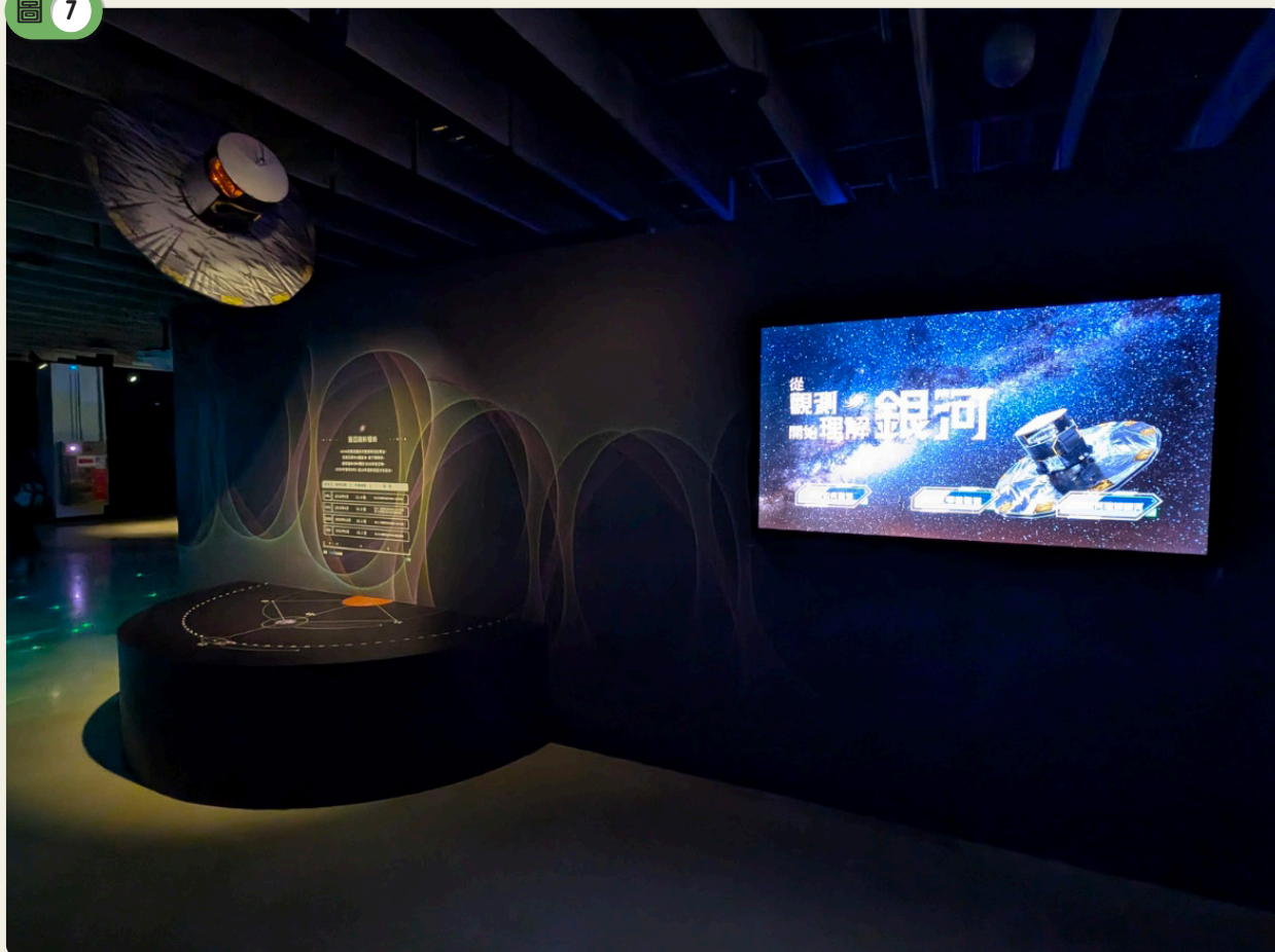
蓋婭任務的觀測與成果，可點選進去了解蓋婭的觀測設備與運作軌道。