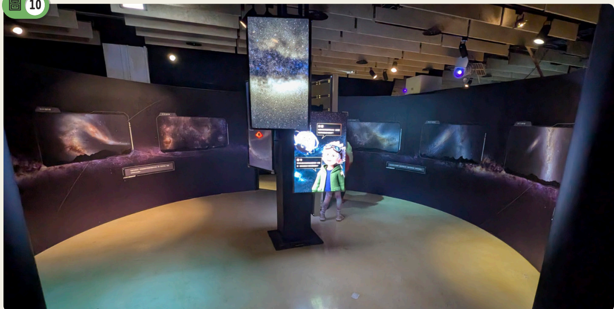
預測未來仙女座大星系與銀河系的互動演化過程。