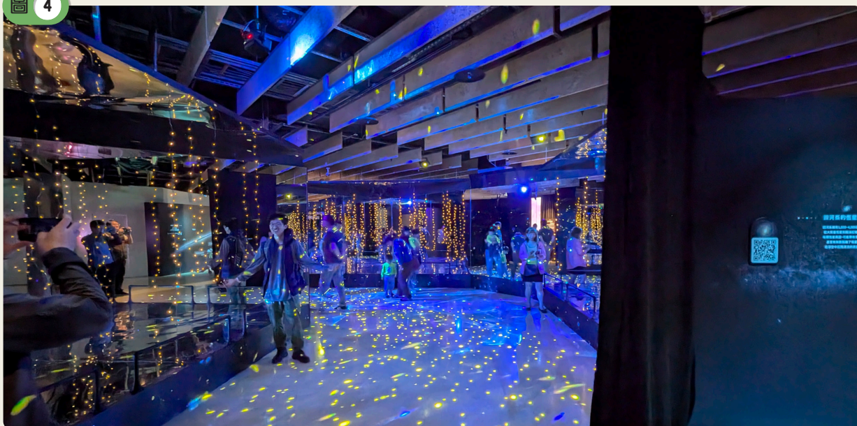
星空過道漫步進入銀河之心。