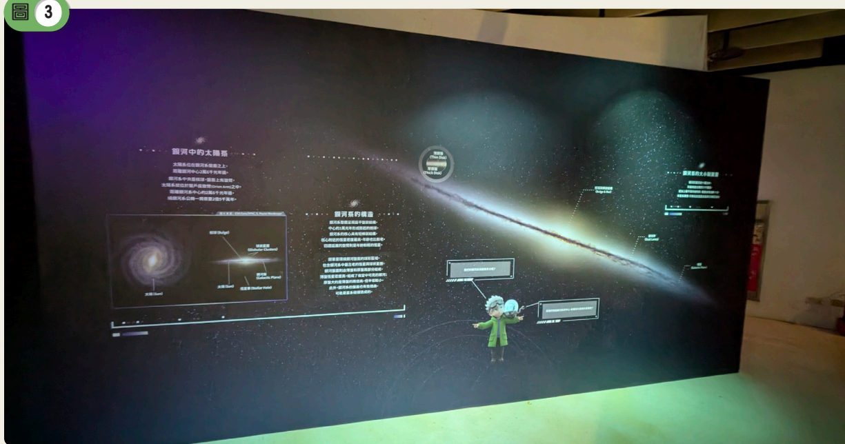
銀河簡介與太陽系的位置。