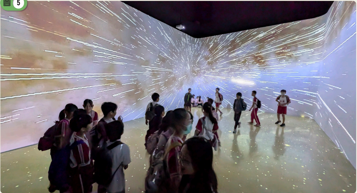
銀河之心沉浸式劇場，覆蓋整個視野的銀河影像。