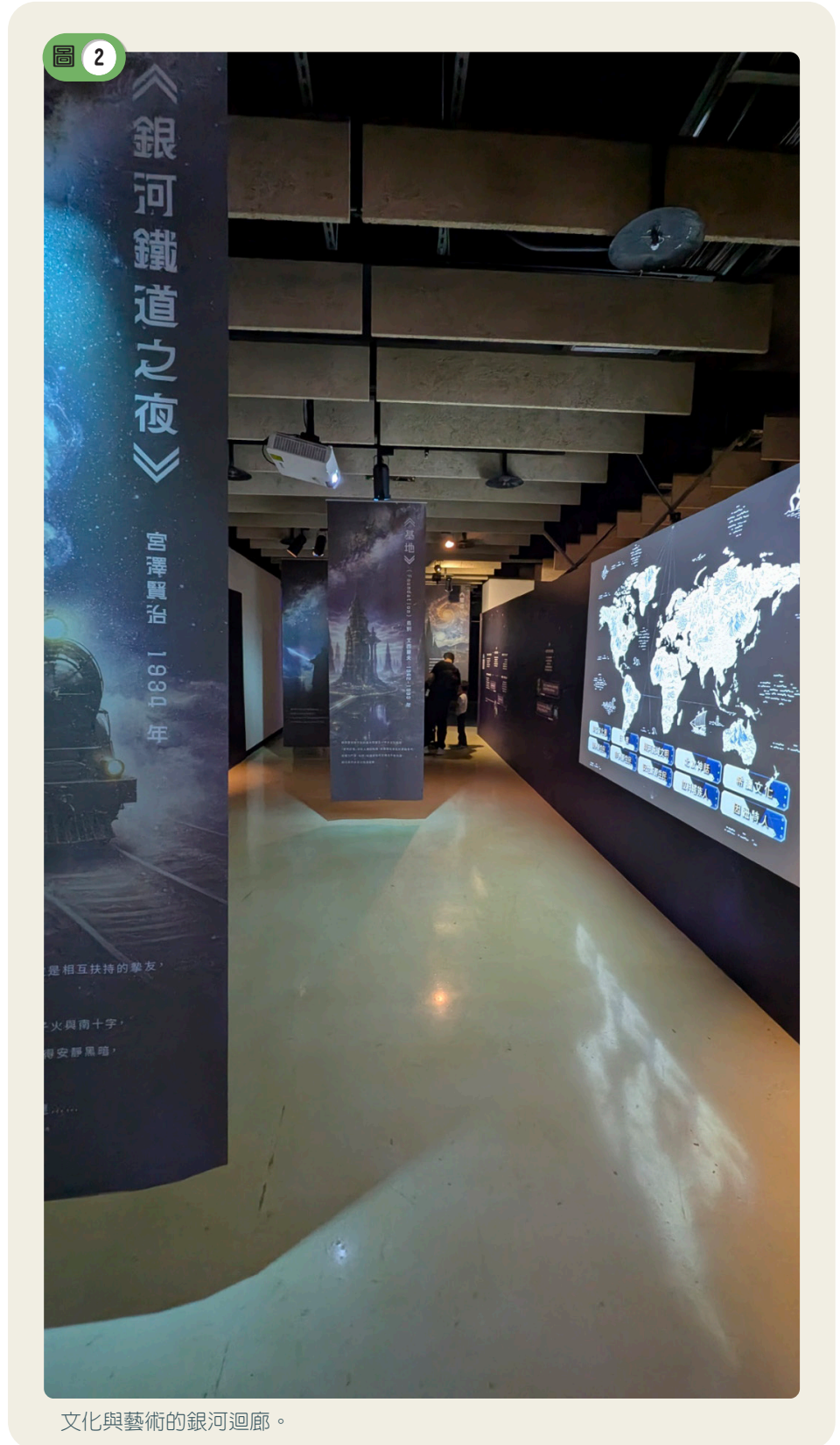
文化與藝術的銀河迴廊。

在文化與傳說的迴廊中，互動式的展板上可以讓您一窺世界各地的文明中銀河扮演的角色，細細品味我們的想像力與文學、繪畫及藝術共同激發出的多采面向，如圖2。