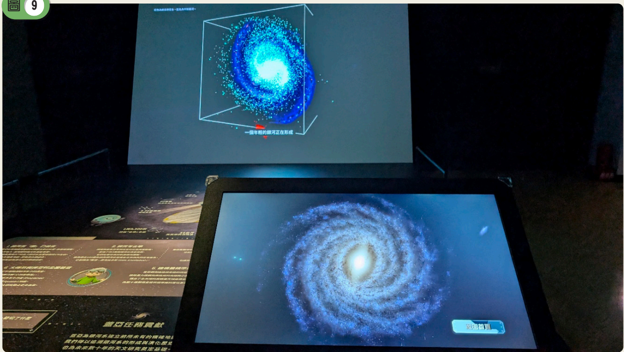
蓋婭任務的重大發現，後面是模擬小星系融入大星系的動態過程。