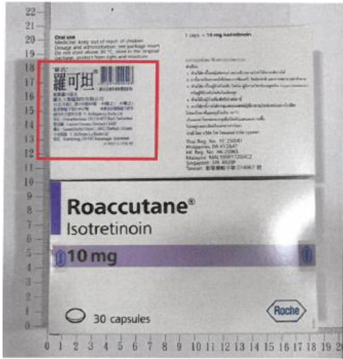
英文外盒中文貼標