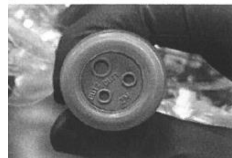
After 易開罐式拉環膠蓋