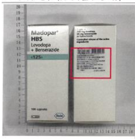
原外盒包裝 (英文外盒中文貼標)