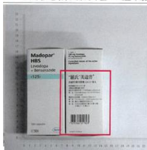
新外盒包裝(中英文外盒，紙盒印製)