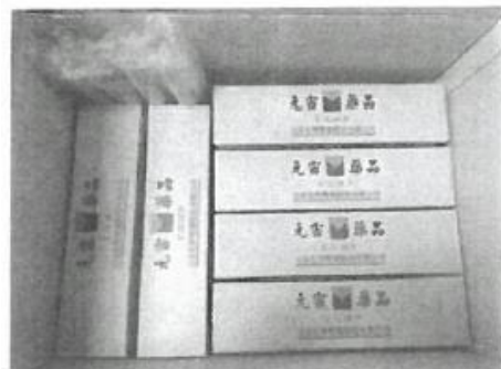
每箱裝 8 外盒