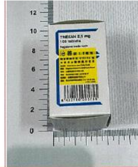
藥品外觀描述 (中文)

黃色、平面圓形裸錠、一面中間有刻痕、另一面標記著 ORN57、直徑 5.9-6.3mm。