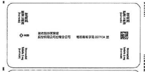
54x 110 mm