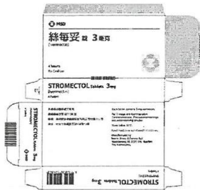
60 x 23 x 115 mm