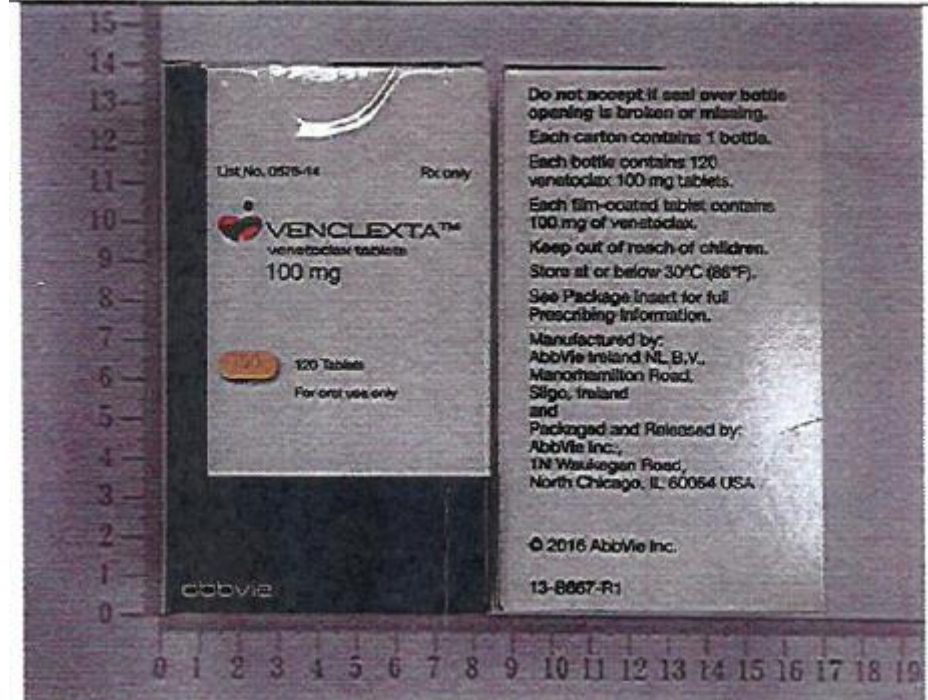
New Pack (100mg x 120 Tab)