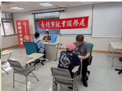
圖：景美站小型徵才