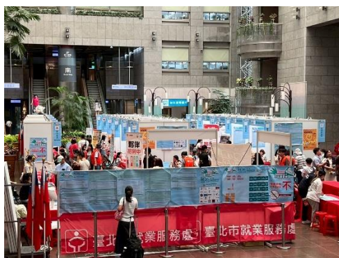
圖：7/18找工作也能很 Chill 聯合徵才

7月18日在市政府1樓中庭舉辦「找工作也能很 Chill」聯合徵才活動，邀請23家優質企業到場，釋出高達1832個職缺。本次活動橫跨電視媒體、科技、製造、旅宿餐飲等產業，提供從管理職、專業技術職到基層職位的多元選擇，起薪平均至少3萬6,000元。而管理階層的職缺佔比達20%，平均起薪4萬2,000元。本次職缺遍布各行各業，包含：生產作業員、機械維修、日文業務助理、人事、品管、職安人員、行政助理、法務、公關、廚師、車輛維修、客服人員、餐廳領檯、酒吧咖啡師、接待與出納等，類型豐富。