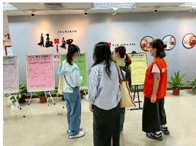
圖：艋舺站小型徵才

7月份本處各就服站辦理55場次徵才活動，邀請零售、餐飲、公共自行車租賃、視聽娛樂、醫療照護等共152家知名企業舉辦微型現場徵才活動，共釋出5,331個工作機會。