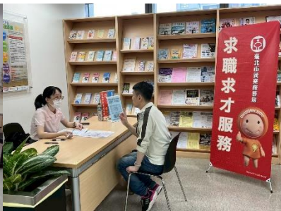
圖：艋舺站小型徵才

7月18日在市政府1樓中庭舉辦「找工作也能很 Chill」聯合徵才活動，邀請23家優質企業到場，釋出高達1832個職缺。本次活動橫跨電視媒體、科技、製造、旅宿餐飲等產業，提供從管理職、專業技術職到基層職位的多元選擇，起薪平均至少3萬6,000元。而管理階層的職缺佔比達20%，平均起薪4萬2,000元。本次職缺遍布各行各業，包含：生產作業員、機械維修、日文業務助理、人事、品管、職安人員、行政助理、法務、公關、廚師、車輛維修、客服人員、餐廳領檯、酒吧咖啡師、接待與出納等，類型豐富。