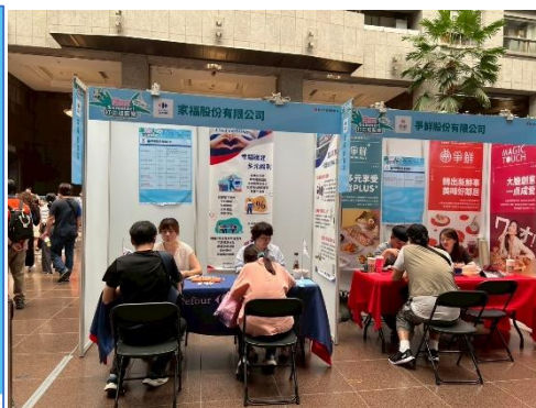
圖：7/18聯合徵才現場面試情形