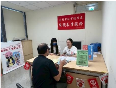
圖：艋舺站小型徵才

6月份本處各就服站辦理48場次徵才活動，邀請旅宿餐飲、批發零售、照顧服務、視聽娛樂、自行車租賃、公共工程等共120家知名企業舉辦微型現場徵才活動，共釋出4,413個工作機會。