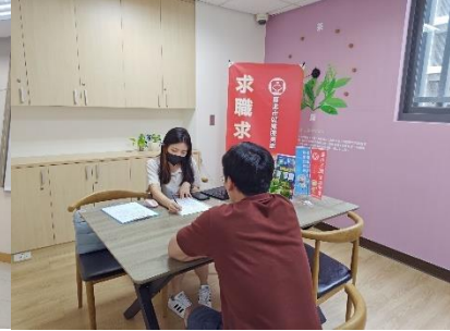
圖：南港東明站小型徵才

6月20日在市政府1樓中庭舉辦「Fun Summer 打工迎新樂」聯合徵才活動，邀集25家優質廠商參與，最高時薪上看336元。本次徵才特別設計多項暑期工讀職缺，工作內容包含商品陳列、倉儲整理、收銀、餐飲內外場等，適合希望短期打工的族群。現場也提供多項正職職缺，包括餐飲店經理、中餐廚師、社群企劃專員、系統開發工程師、會計、法務、藥師等。活動現場也提供臨時托育服務與手語翻譯，並設有勞動局求職防騙宣導攤位，以及勞動部「初次尋職青年穩定就業計畫」宣導；臺北市榮民服務處將協助退除役官兵二度就業；原民會則提供原住民族求職協助；另有臺北市職能發展學院提供職訓課程諮詢，資源一站到位。