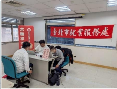
圖：景美站小型徵才