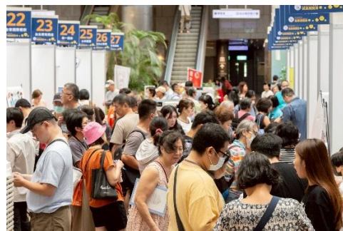
圖：6/28就業博覽會當日湧入人潮