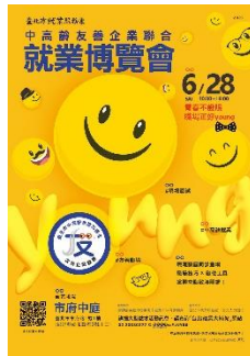
圖：6/28就業博覽會海報