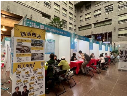
圖：Fun Summer 打工迎新樂聯合徵才