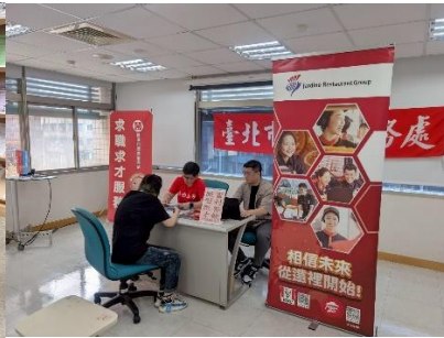
圖：景美站小型徵才