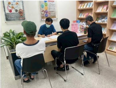
圖：艋舺站小型徵才

5月份本處各就服站辦理52場次徵才活動，邀請五星級飯店、連鎖超商、人氣餐飲、物流宅配、公共自行車、保全與居家長照等共129家知名企業舉辦微型現場徵才活動，共釋出5,095個工作機會。