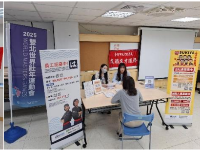
圖：內湖站小型徵才

為協助企業及早因應高齡少子化帶來的人才荒與混齡職場挑戰，5月14日在政大公企中心舉辦「Be A Shaper 壯闊新領航—全齡友善標竿企業高峰會」，邀集國內外產業專家與標竿企業齊聚臺北，分享中高齡就業實務與全齡職場創新做法，帶領企業一同在變局中找出人力永續的新出路。此次高峰會設計三大主軸，從「超高齡時代的人才思維」、「中高齡友善的全齡職場」到「創新競爭力的永續領航」，期待激發更多企業加入全齡職場行列，打造友善又有競爭力的工作環境。線上線下最高同步參與人數計702人。