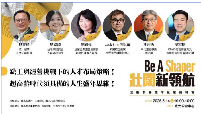
圖：全齡友善標竿企業高峰會

5月17日在台北車站1樓車站大廳舉辦「114年畢業季暨北市科技園區聯合招募活動」，總計50+頂尖企業參與徵才，涵蓋資訊科技、半導體、電信通訊、綠色能源、生技醫療、金融科技等多元產業，提供近1,200個職缺，平均月薪4萬1,000元。現場也有300+零門檻職缺，及「成為職場前輩最愛的怪物新人—這5個特質都有，我就問是要怎麼輸！」與「人資視角-履歷及面試中的致勝關鍵」兩場講座，吸引許多求職民眾參加。