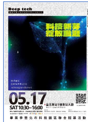
圖：就業博覽會海報