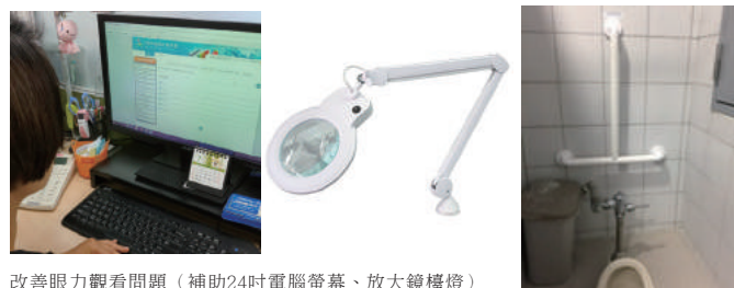
改善眼力觀看問題 (補助24吋電腦螢幕、放大鏡檯燈)