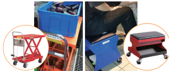
解決徒手垂直搬運問題 (補助油壓升降臺車)