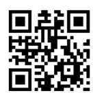
Taipei City Employment Service Office