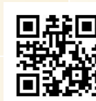
Taipei City Employment Service Office