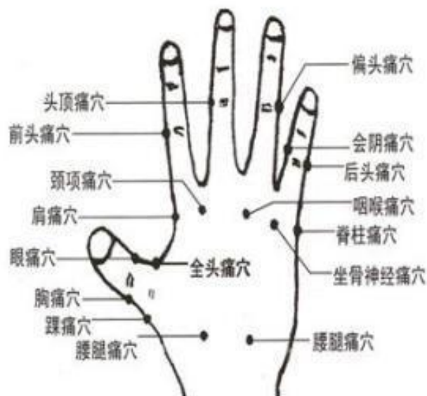
小兒夜尿穴位圖示 (手掌正面)

夜尿穴位於掌面小指的 2 關節橫紋中點處，主治夜尿、尿頻，對於小兒尿床效果最佳。每次點壓 3-5 分鐘，每次療程 15 分鐘。