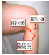
陽陵泉穴位位置圖