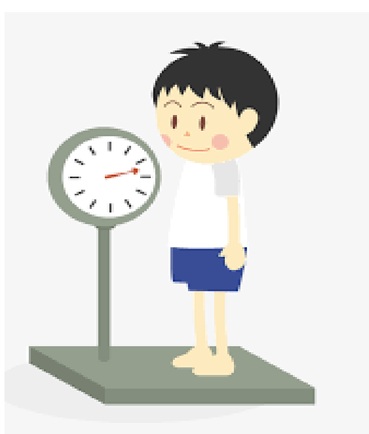
避免過度承受身體重量