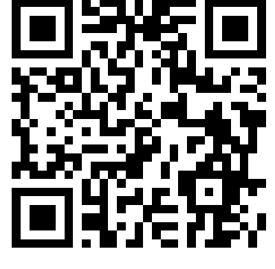
臺北市使用執照 查詢