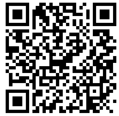
全國地政電子謄本系統