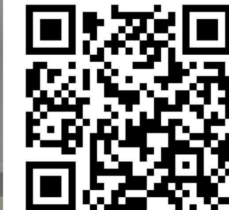
臺北市土地使用分區查詢