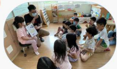
分享自己的感受讓小導遊們知道

小導遊們帶完旅遊團後，提出他們需要瞭解小旅客們在這趟旅程中的感受～最後經過大家討論後，決定讓旅客們進行評價、提供建議作為往後的改善!