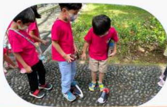
石頭步道採起來的感覺很特別!