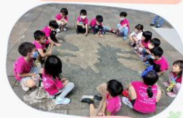
在這個公園裡有好多好多龍的圖案及裝飾!