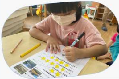
小旅客們進行旅遊回饋中