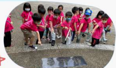
大家討論著龍鼓台可能是要做什麼~