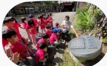
看到石碑上有記載著龍舞廣場的相關習俗