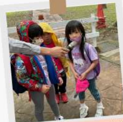
有獎徵答時間～我答對囉!