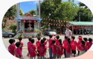
發現這邊有裝升降裝置的土地公廟!