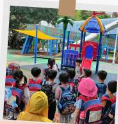
小導遊解說天空樹的由來