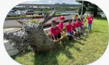
這邊還有樹枝做的龍舟耶!