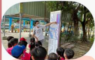
從觀看三腳渡河濱公園地圖中得知相關資訊

在上回踏查前港公園後，大家對於其他兩個景點都充滿期待~同時在過程中觀察到更多有趣的事物!