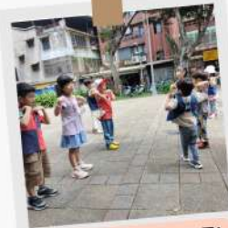
運動前要先暖身喔!