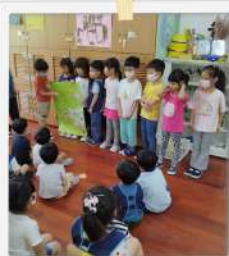
歡迎加入～快樂三腳渡