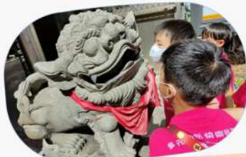
我們發現兩隻石獅子有些不同!