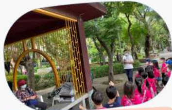
觀察到有許多阿公阿嬤在涼亭下休息或聊天