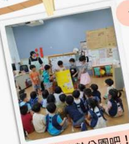
一起來華齡公園吧！