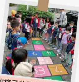
跳格子的形狀像機器人