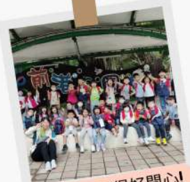
大合照～玩得好開心!