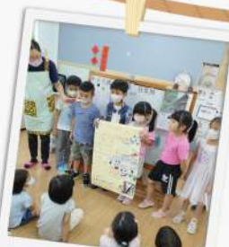
快來參加～天空樹之旅