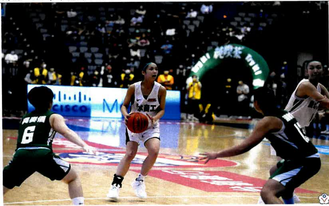
圖說：110學年度高中籃球甲級聯賽總決賽女子組比賽賽況