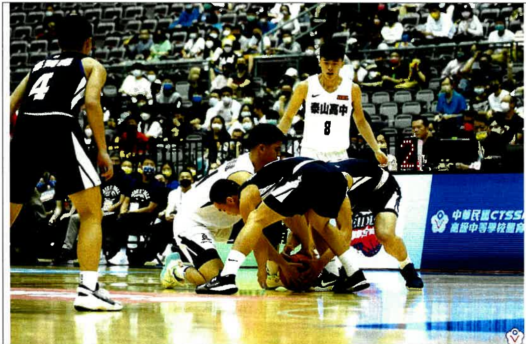
圖說：110學年度高中籃球甲級聯賽總決賽男子組比賽賽況

說明：請至少檢附8張照片，照片主題應包含場地規劃運用、活動舉辦情況及觀眾參與情形