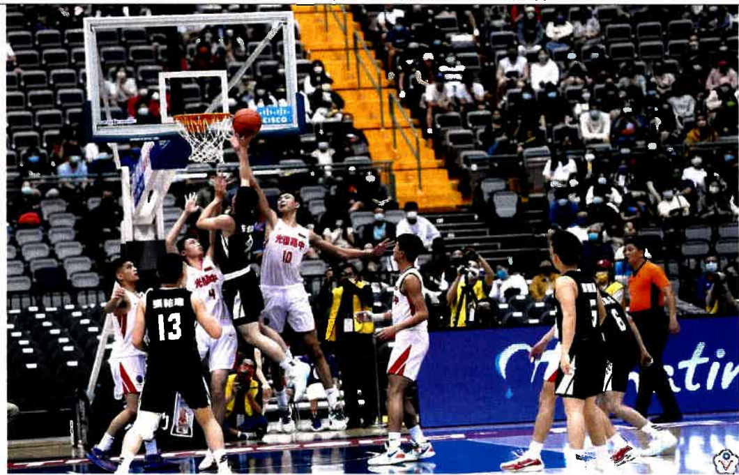
圖說：110學年度高中籃球甲級聯賽總決賽男子組比賽賽況