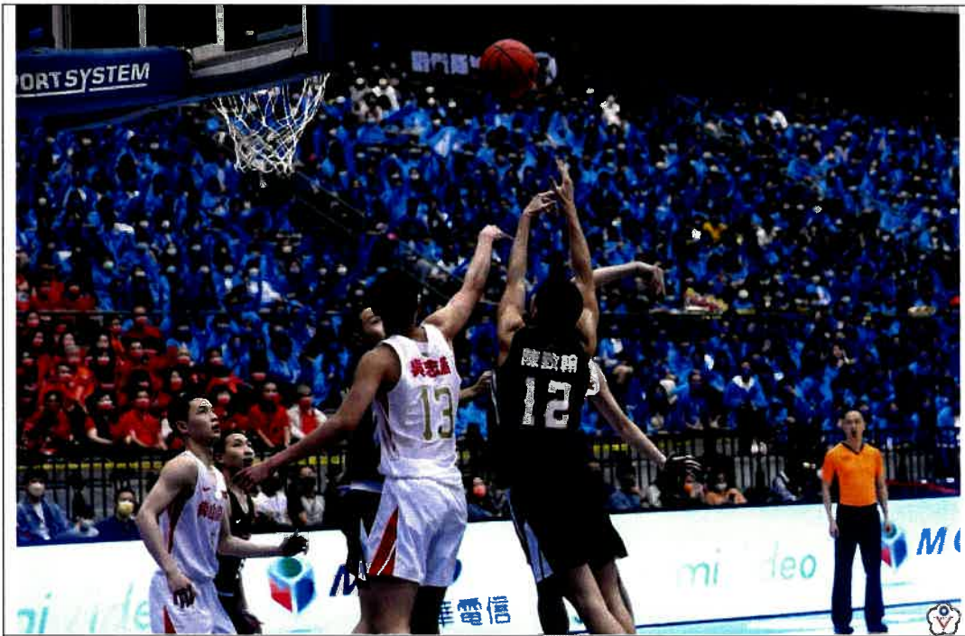
圖說：110學年度高中籃球甲級聯賽總決賽男子組比賽賽況