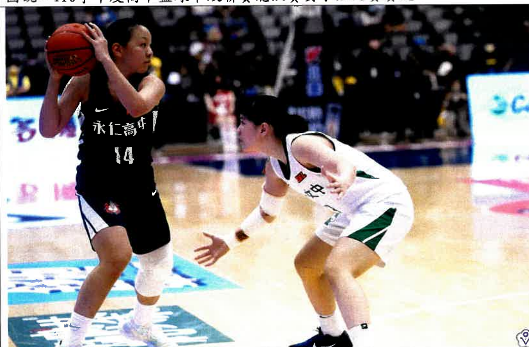
圖說：110學年度高中籃球甲級聯賽總決賽女子組比賽賽況