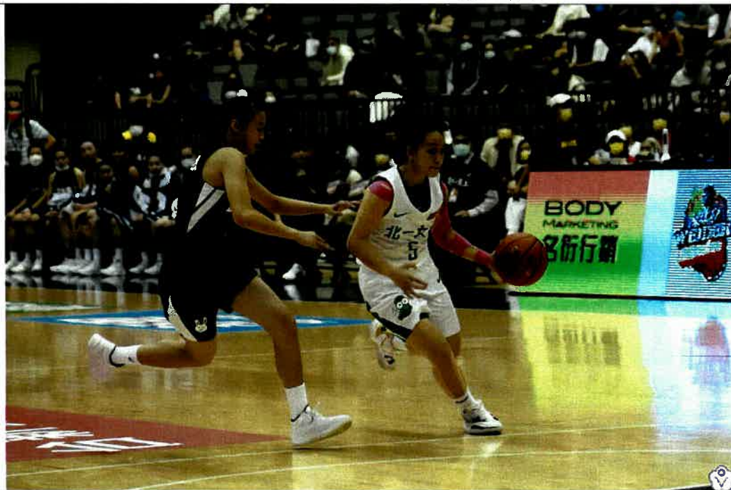
圖說：110學年度高中籃球甲級聯賽總決賽女子組比賽賽況