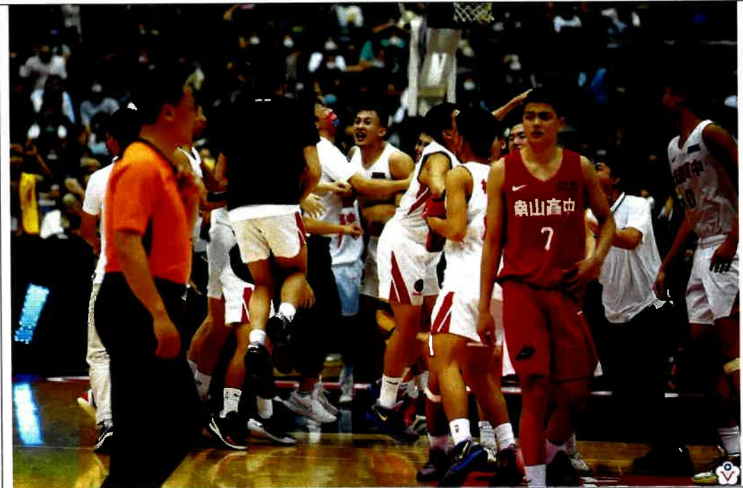
圖說：110學年度高中籃球甲級聯賽總決賽男子組比賽賽況