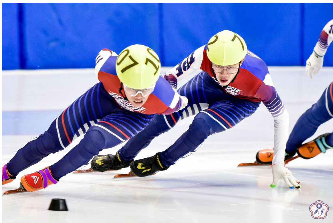
↑ 圖二：大專社會公開組選手比賽照片