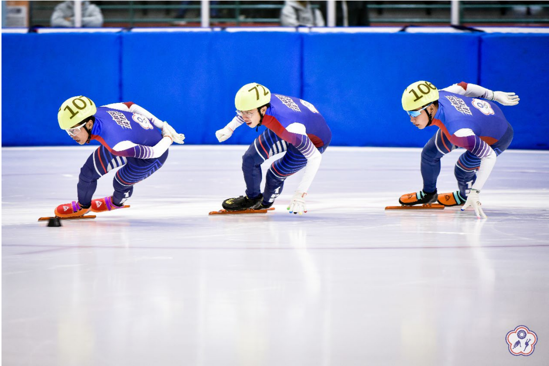
↑圖三：大專社會公開組選手比賽照片