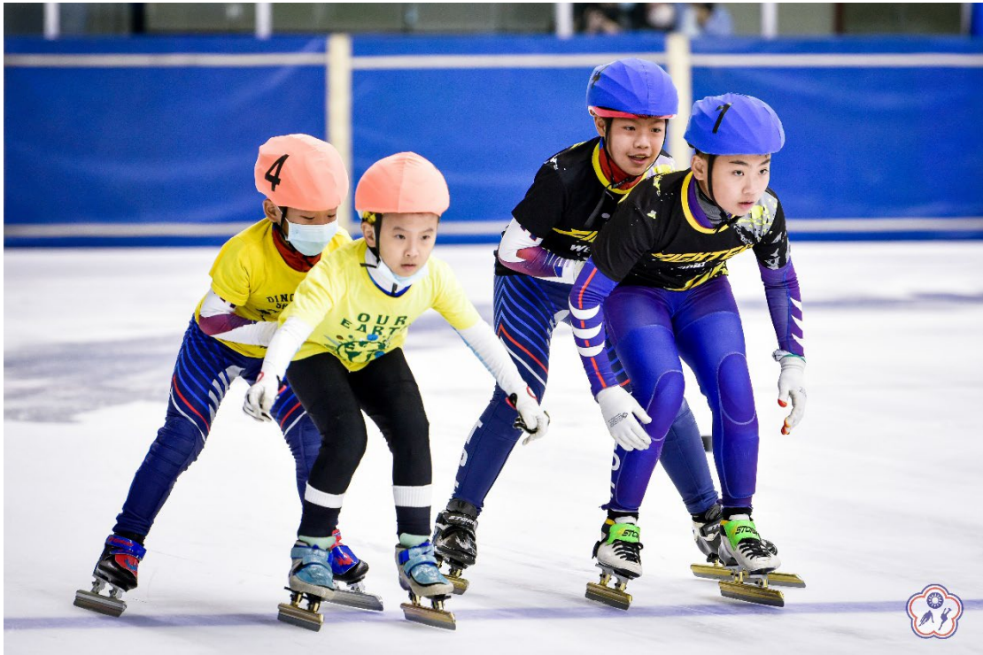
↑圖七：國小男子團隊接力選手比賽照片