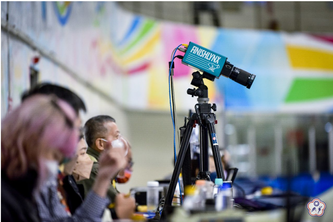
↑圖十：FinishLynx 終點攝影計時系統