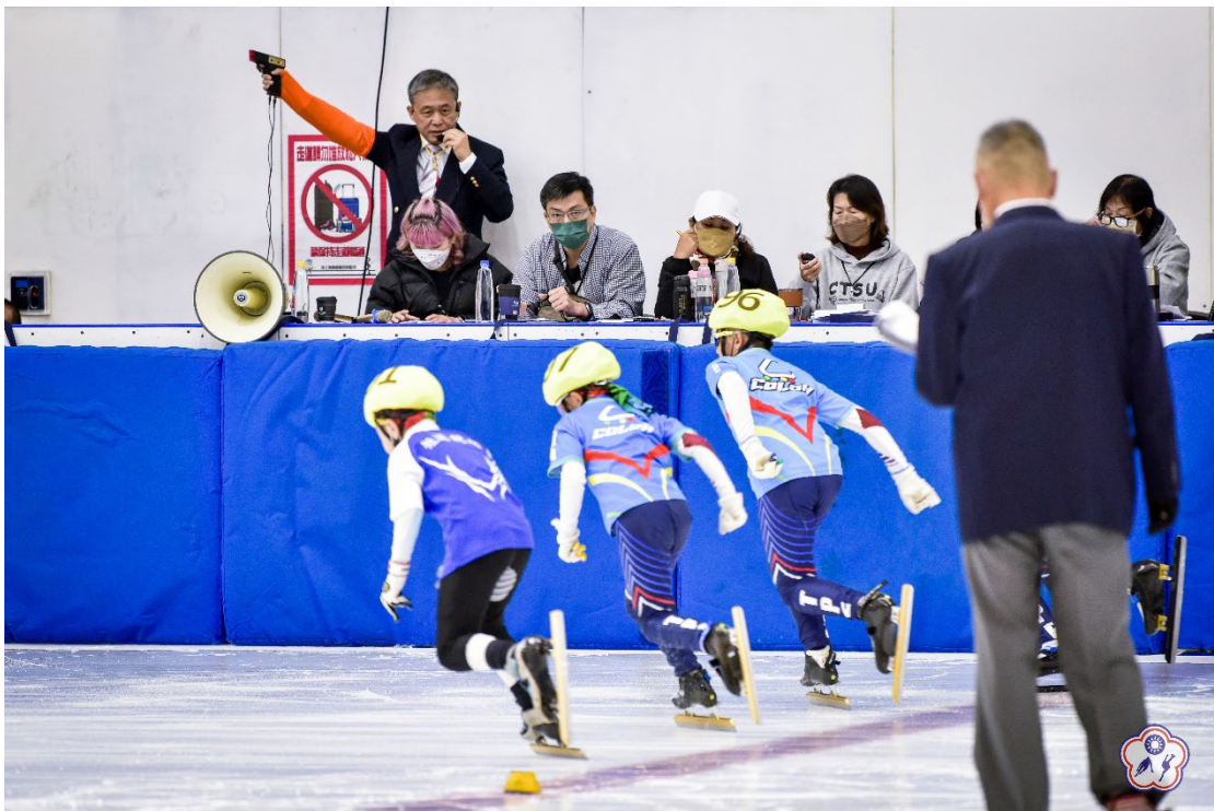
↑圖六：國小高年級男子公開組選手比賽照片