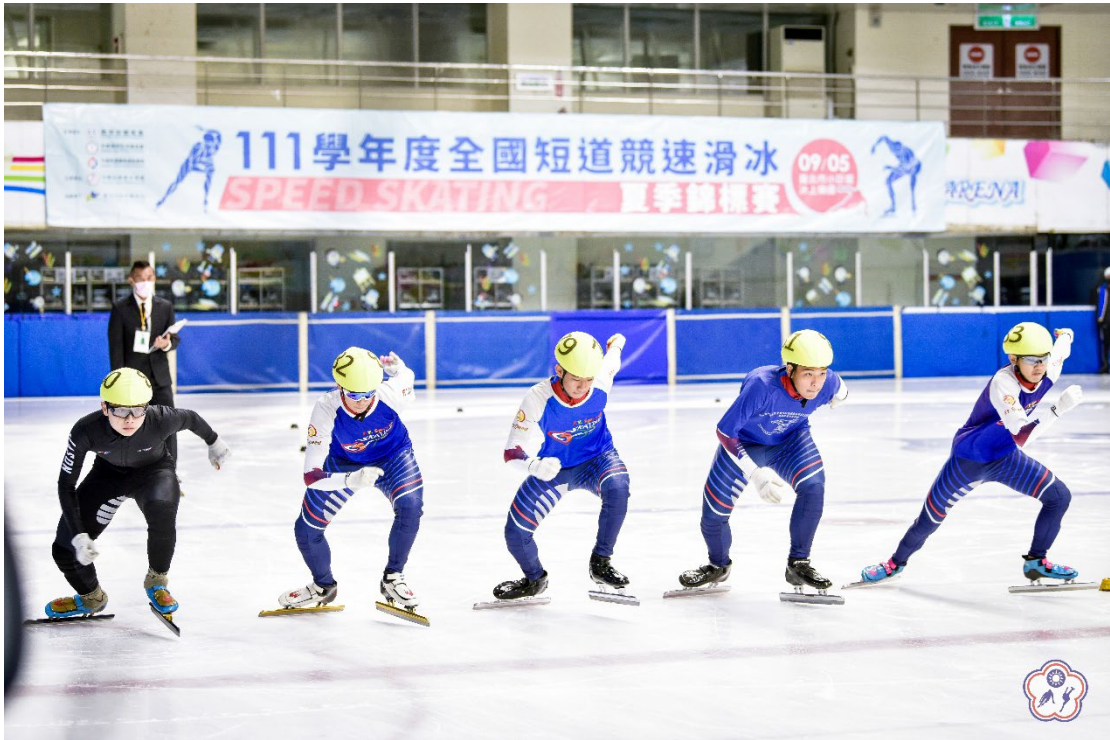
↑圖五：高中男子公開組選手比賽照片