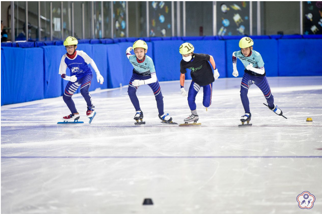
↑圖四：國中男子公開組選手比賽照片