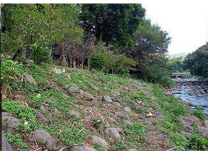
至善天下社區右岸護岸