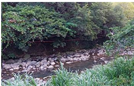
青青農場斷左岸漿砌卵石護岸