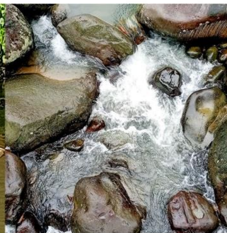
自強橋上游急瀨區