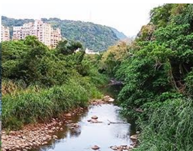
自強橋上游右岸自然水岸