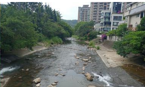
婆婆橋下游側混凝土護岸