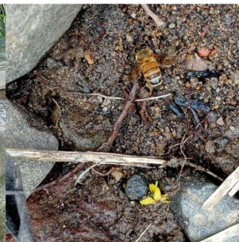
至善橋上游岸邊泥灘地