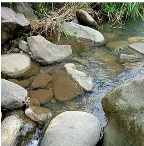
劍南橋下游岸邊緩流