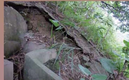
▲ 既有護坡設施老舊破損

民眾如發現社區異常徵兆，可撥打1999，電洽臺北市政府工務局大地工程處(坡地住宅科)，將免費安排專業技師至現場勘查，並提供改善建議。