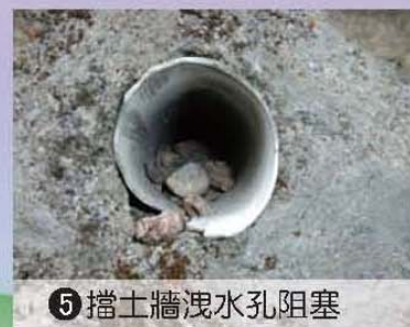
5 擋土牆洩水孔阻塞