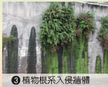
3 植物根系入侵牆體