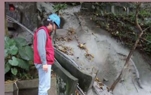
▲ 社區自行修復損壞之護坡設施

臺北市政府工務局大地工程處輔導社區進行改善後，持續追蹤觀察改善成效，以確保社區環境安全。