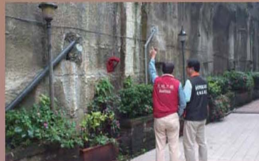
▲ 專業技師勘查及輔導

民眾如發現社區異常徵兆，可撥打1999，電洽臺北市政府工務局大地工程處(坡地住宅科)，將免費安排專業技師至現場勘查，並提供改善建議。