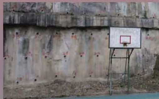
▲ 社區自行安裝洩水孔

臺北市政府工務局大地工程處輔導社區進行改善後，持續追蹤觀察改善成效，以確保社區環境安全。