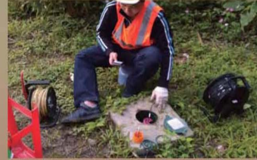
▲ 臨近順向坡社區安全監測

為加強山坡地住宅安全，臺北市政府工務局大地工程處每年皆針對列管山坡地住宅社區進行巡查，並輔導居民辦理自主檢查。