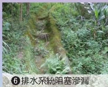
6 排水系統阻塞滲漏